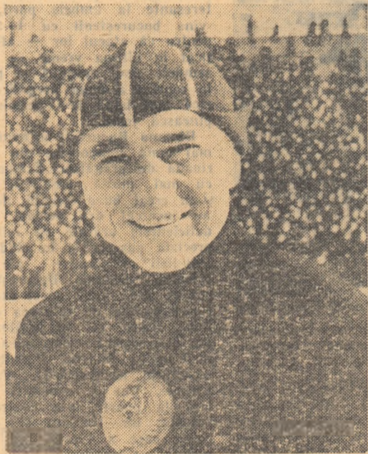
Dublul campion olimpic și recordmanul mondial pe 500 m, Evghenii Grișin (U.R.S.S.).

SARITURI SPECIALE. Ultima întrecere a schiorilor a adunat în jurul trambulinei de sărituri un număr de 20.000 spectatori. Încă înainte de începerea concursului, cele mai des repetate nume erau acelea ale cunoscutului sportiv din R. D. Germană, Helmuth Recknagel și ale campionului finlandez Nilo Halonen. Ei reușiseră cele mai bune sărituri la antrenamentul din ajun: Halonen 93 m. și Recknagel 91 m. Așteptările au fost pe deplin confirmate, cei doi sportivi situîndu-se pe primul plan al luptei pentru ultimul titlu olimpic. Cu o săritură de 93 m. care a obținut cel mai înalt punctaj — 117,6 p. — Helmuth Recknagel a luat conducerea de la prima încercare. El a ocupat primul loc și în clasamentul final, cucerind astfel cea mai frumoasă victorie din prodigioasa sa carieră. Pe următoarele două locuri: 2. N. Halonen (Finl.), 3. Otto Leopold (Austria).