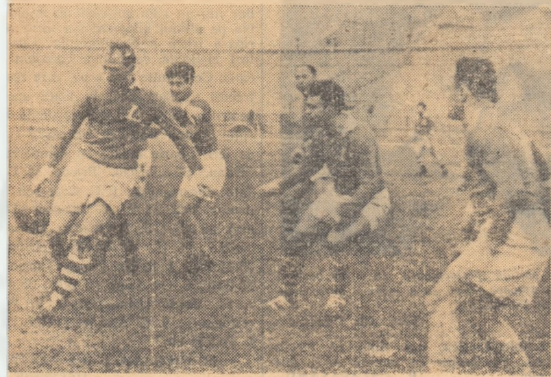
Fază din întîlnirea C.F.R. Grivița Roșie-Progresul

● Dinamo-Metalul M. I. G. 19—11 (6—6, 11—11). Jucînd cu o dirigență rar întîlnită, metalurgii și-au obligat echipa Dinamo să facă apel la toate resursele pentru a reuși (abia în prelungiri) să cîștige. Partida a fost spectaculoasă și disputată într-un ritm extrem de rapid. Am remarcat multe combinații tactice reușite, care s-au soldat cu încercări spectaculoase. Punctul forte al Metalului l-a constituit înaintarea, care datorită mobilității sale a acoperit tot terenul. Dinamo, folosînd deschideri rapide și