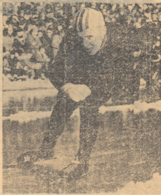
Un valoros record al lumii a fost stabilit de campionul european Knut Johannessen (Norvegia)