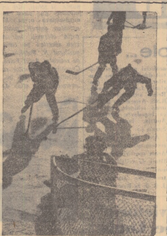
Pe uriașele întinsuri ale Chinei Populare, iarna și vara reușesc să-și dea mîna. În sudul țării au venit mai de mult zilele calde. Atletii, fotbalistii, jucătorii de volei, de baschet sau de tenis se simt în largul lor pe terenuri. În nord însă continuă sezonul de iarnă. La Harbin, unde anul trecut a fost încheiată construcția unui mare combinat pentru sporturile de iarnă, au avut loc recent întrecerile celor mai buni hocheiști. Ca și la trecuta ediție a campionatului, pe primul loc s-a clasat echipa orașului Harbin.

Comitetul executiv al U.E.F.A. a aprobat organizarea unui meci între câștigătoarea „Cupei Campionilor Europeni” și câștigătoarea „Cupei Campionilor Americii de Sud”.