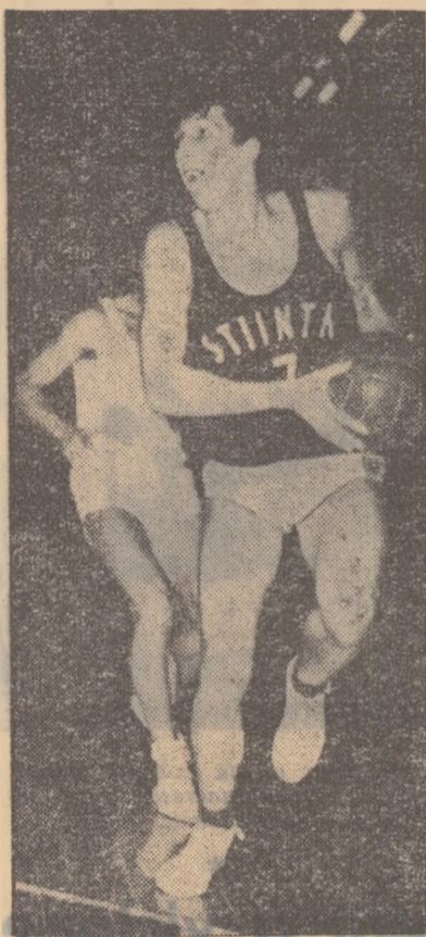
VIZI (Știința Cluj)

În campionatul feminin vor avea loc două meciuri cu caracter decisiv pentru codagele clasamentului: C.S.S. Banatul Timișoara și Voința București, care vor întîlni pe teren propriu echipele I.C.F. și respectiv Știința Cluj, au o bună ocazie de a adăuga 3 puncte „bagajului“ lor și așa destul de restrîns. Frunțasele, Știința București și Rapid susțin jocuri ușoare cu Progresul și respectiv Voința Or. Stalin, iar cea mai echilibrată întîlnire are loc la Oradea, între C.S.O. și C.S. Tg. Mureș. Citii programul complet al jocurilor acestei etape la rubrica „Unde mergem?“.