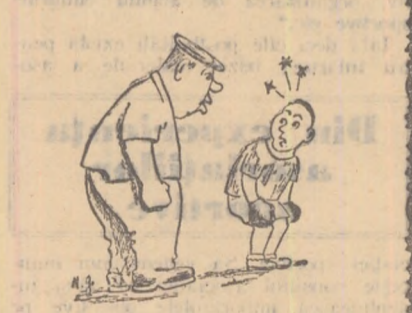
Desen de N. GHENADIE

Din două, una: ori renunți la asemenia metode de... instruire sportivă, ori, dacă se simte în puteri, Petre Pop se reintre în activitatea competițională. Acolo, da, se simte nevoia elementelor... combative!