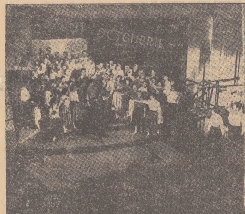
Un moment emoționant din înălțătoarea transpunere scenică a „Poemului lui Octombrie“, de Vladimir Maiakovski

În afara meciului Slavia—Rapid (care va fi condus de arbitru sovietic Arisian), programul de luni din sala Floreasca mai cuprinde și jocul fem-inin de campionat Rapid—Progresul;