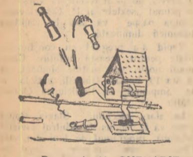
Desen de N. GHENADIE

necesară Ocolului Silvic din Borca. Dar un elementar spirit gospodăresc ar fi trebuit să-i îndemne să ridice acest coșar oriunde în altă parte decît pe un loc unde exista ceva construit.