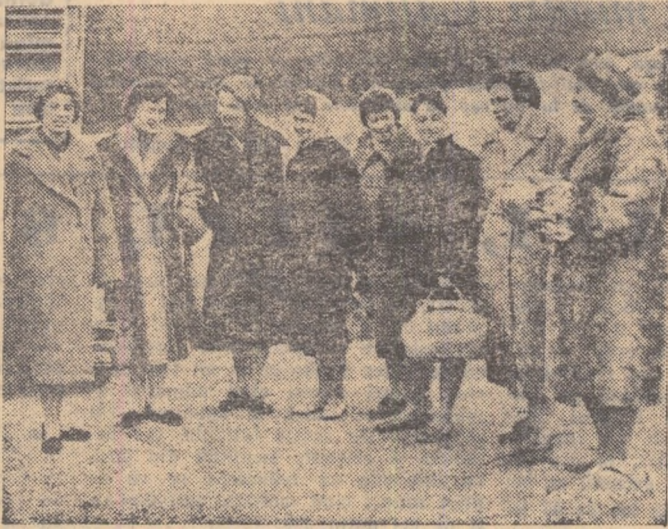
Gimnastele sovietice imediat după sosirea în Capitală

Iată-le. Coboară în... ordinea la salutarile celor ce au ve- performanțelor. Mai întîi cam- pioana mondială și olimpică Federației Romîne de Gimnast-