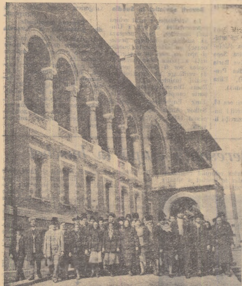
Membrii G.A.C. „30 Decembrie” din comuna Codrești, raionul Rm. Sărat, în fața muzeului V. I. Lenin—I. V. Stalin.