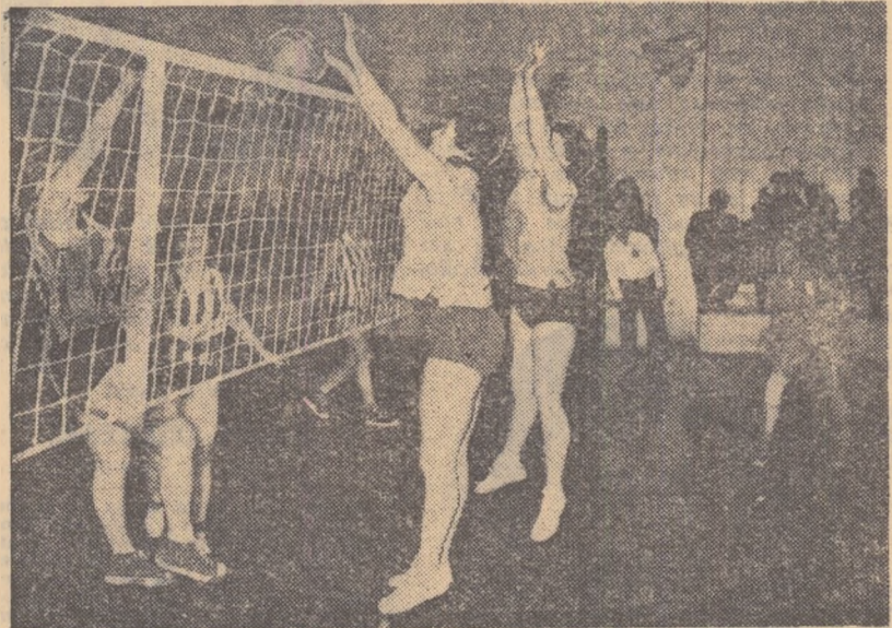
După ce au întâlnit în etapa trecută Rapid București (în fotografie un aspect din acest meci), voleibalistele de la C.P.B. vor juca cu Dinamo București. Cum se vor comporta ele?