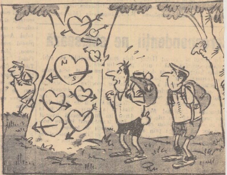
— Ei, ... care o fi cea bună?...