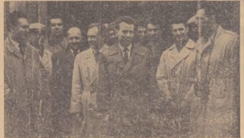
Voleibaliștii de la Slavia Praga, după antrenamentul făcut în sala Giulești.

Meciul se anunță extrem de disputat pentru că feroviarul vor trebui să învingă cu 3-1 pentru a avea calificarea asigurată, și interesant pentru că se întîlnesc două echipe cu două sisteme de joc diferite. Slavia practică jocul specific cehoslovac, economic, cu atacuri variate (de regulă cu mingi lîftate sau „puse“), în timp ce Rapid folosește mingile frase puternice, combinate cu cele „puse“.