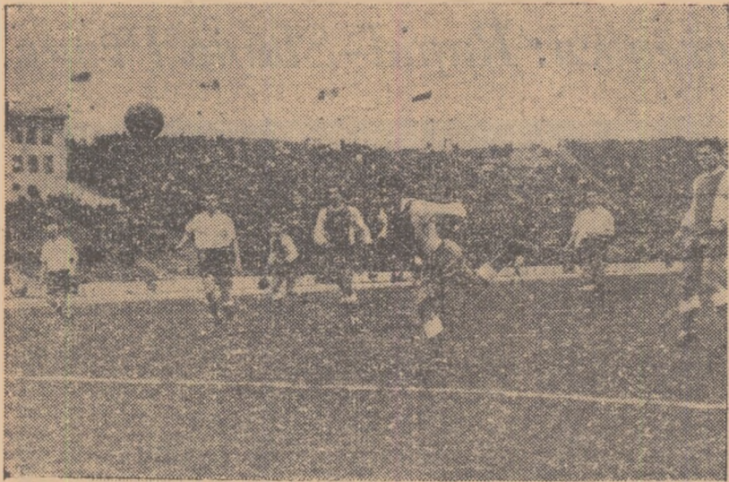
Marin (Progresul), în poziție clară, reia mingea cu capul, dar alături de poartă, față din meciul Progresul - Jiul (2-1).