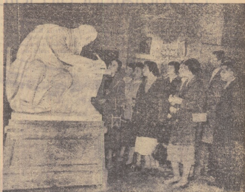
Grupul de sportivi s-a oprit acum în fața statuiei „V. I. Lenin la Razliv” de I. Pinciuk.