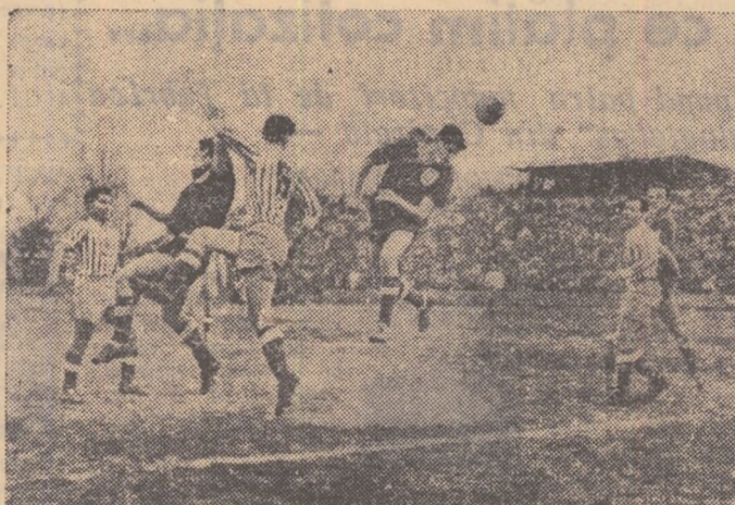
Iată în fotografia noastră o fază la poarta C.S.M.S. Mingea trimisă spre poartă cu capul de către un atacant dinamovist va fi însă reținută de către portarul Ursache (Dinamo Galați-C.S.M.S. Iași 6-1)