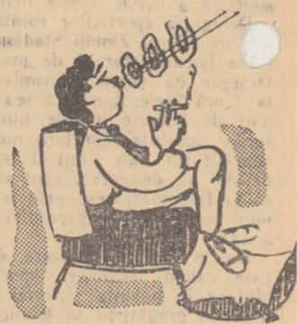
Cum înțelege consiliul asociației „Petrolul” munca de stringere a cotizațiilor