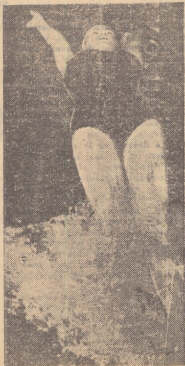
Start pentru Maria Both în clasică probă de 100 m spate

Oricum, apreciînd că o întoarcere în plus aduce un avantaj de 5-7 zecimi