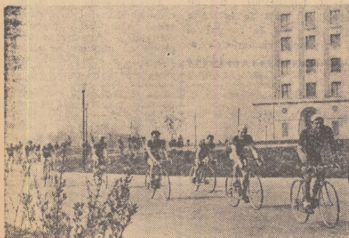
Plecarea participanților în cursa ciclistă organizată duminică pe șoseaua București-Ploiești de Consiliul U.C.F.S. al raionului I. V. Stalin