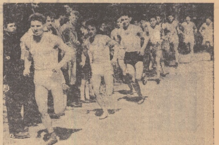
Aspect din cursa seniorilor (10.000 m) din cadrul campionatelor republicane de cros de la Sibiu