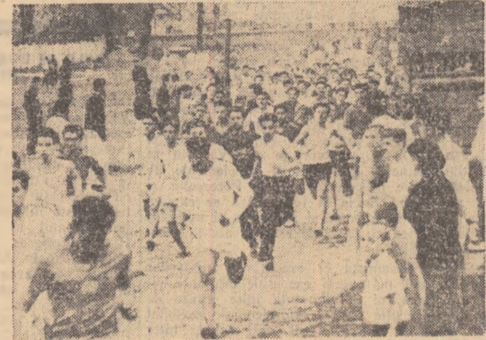
La seniori, după primii pași, a și început lupta pentru ocuparea unui loc cit mai bun...

În multe comune din raion s-a desfășurat, într-un cadru festiv, crosul „Să întîmpinăm 1 Mai”. Dintre numeroșii concurenți, care au luat startul în comuna Tariverde, s-au clasat pe primele locuri următorii: Gh. Dăileanu, Gh. Roșca și V. Burlan. M. CRUCIANU, coresp.