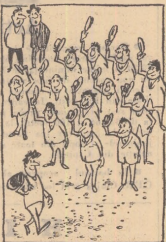
De ce-l salută toți atît de respectuos?

Nu se poate spune că activitatea sportivă din orașul Sinaia s-a ridicat la nivelul condițiilor existente. Și, cu toate acestea, sînt cheltuite încă sume de bani pentru o serie de acțiuni nejustificate. De asemenea, după părerea mea, se fac cheltuieli exagerate cu salariile, ceea ce încarcă mult bugetul unor asociații. Astfel, Avîntul Sinaia — asociație care numără 400 de membri — propunea 22.000 lei pentru salarii (față de 17.685 lei în 1959) deși activitatea este redusă în pofida faptului că aici există echipament și materiale de aproape 250.000 lei. O serioasă majorare (complet nejustificată) la capitolul salarii a prevăzut și asociația Voința (29.500 față de 25.889 în anul 1959) deși numărul membrilor UCFS a scăzut la 305 iar activitatea este destul de slabă. Exemplele pot continua cu asociația Carpați Sinaia unde în 1959 s-a cheltuit cu salarii suma de 18.716 lei iar pentru acest an s-a prevăzut suma de 29.875 lei. În acest fel este lesne de înțeles că nu vor putea fi realizate economii ei, dimpotrivă, se vor irosi sume de bani cu care s-ar putea face multe lucruri bune și necesare în orașul Sinaia pentru dezvoltarea sportului de mase. Orientarea greșită a consiliilor acestor asociații își găsește explicația și în neglijarea activității sportive de mase, în preocuparea exclusivă pentru echipele participante în diferite campionate oficiale. Pentru