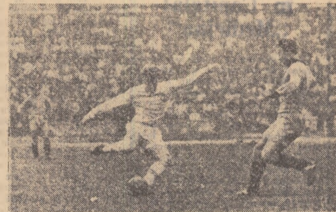
Țircoviuc (Dinamo Bacău) și Zavoda I (C.C.A.), într-o fază dintr-un joc pe stadionul Republicii. Miine, ei se vor întîlni din nou, la Constanța

● Cupla la București, pe „Dinamo”: Dinamo — Petrolul și Rapid — Steagul roșu ● Meciuri atractive la Constanța: Farul — Progresul și C.C.A. — Dinamo Bacău ● La Petroșani: Jiul — Minerul