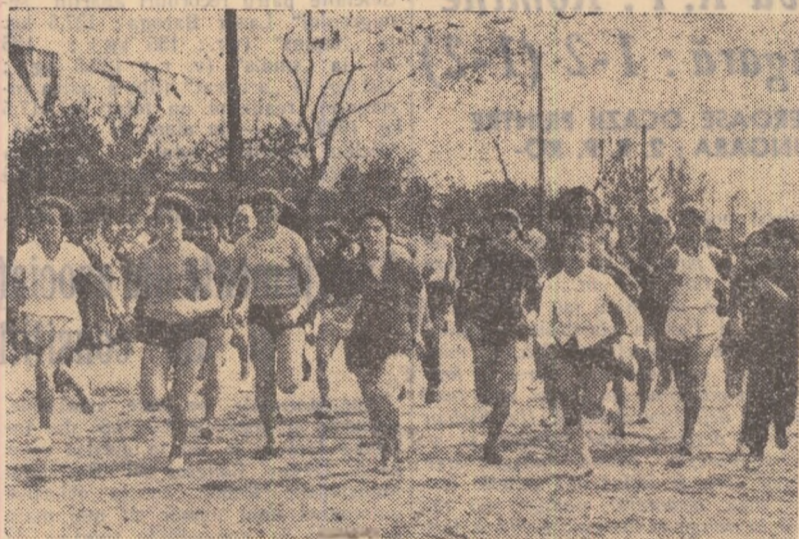
Cîteva clipe după plecare. În lupta pentru victorie sînt aruncate toate forțele. (Urmare din pag. 1)

vine sportivilor din raionul Stalin, clasăți pe primul loc cu 188 puncte. Sînt urmați în ordine de cei din raioanele 1 Mai, cu 284 puncte, Pe locurile 3-4, sportivii din raioanele