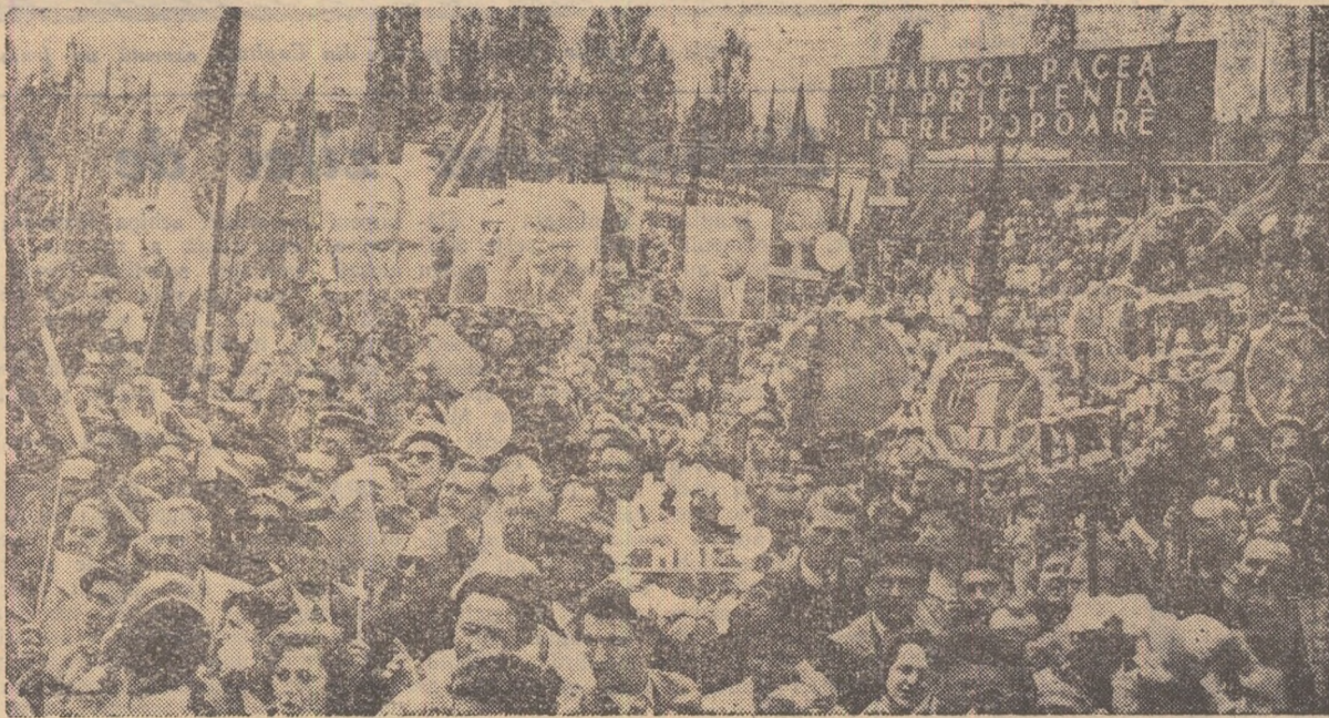
Intr-un entuziasm general, oamenii muncii din Capitală salută călduros pe conducătorii partidului și guvernului

Asemenea unui șuvoi viu, în piață își fac apariția coloanele de demonstrații. Printre steaguri roșii și tricolor, portrete, flori, baloane multicolore; peste marea de capete plutesc