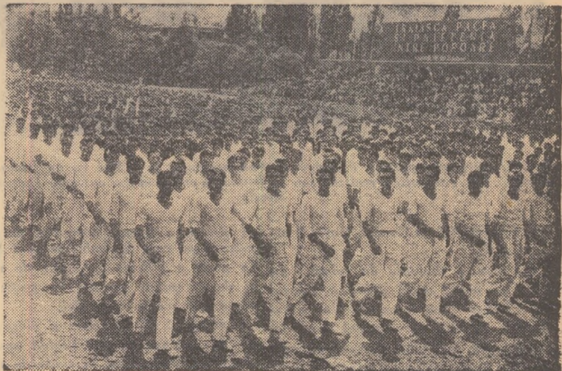
In rînduri compacte, plini de forță și sănătate, trec sportivii bucureșteni

... „TRAIASCA 1 MAI, ZIUA SOLIDARITĂȚII INTERNAȚIONALE A CELOR CE MUNCESC” — citim pe uriașă pancartă purtată de grupul masiv de tineri care trece acum prin fața tribunelor. De 1 Mai, sportivii Capita-