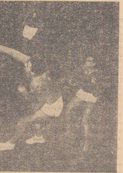
Fază din meciul Rapid — Constructorul (m)

Constanța. În meciul cu Rapid București, voleibalistele de la Petrolul au condus cu 2—1 la seturi, dar au „căzut” în ultima parte a jocului pierzînd cu 2—3 (12—15, 15—9, 18—16, 4—15, 4—15). (E. PETRE-coreesp.)