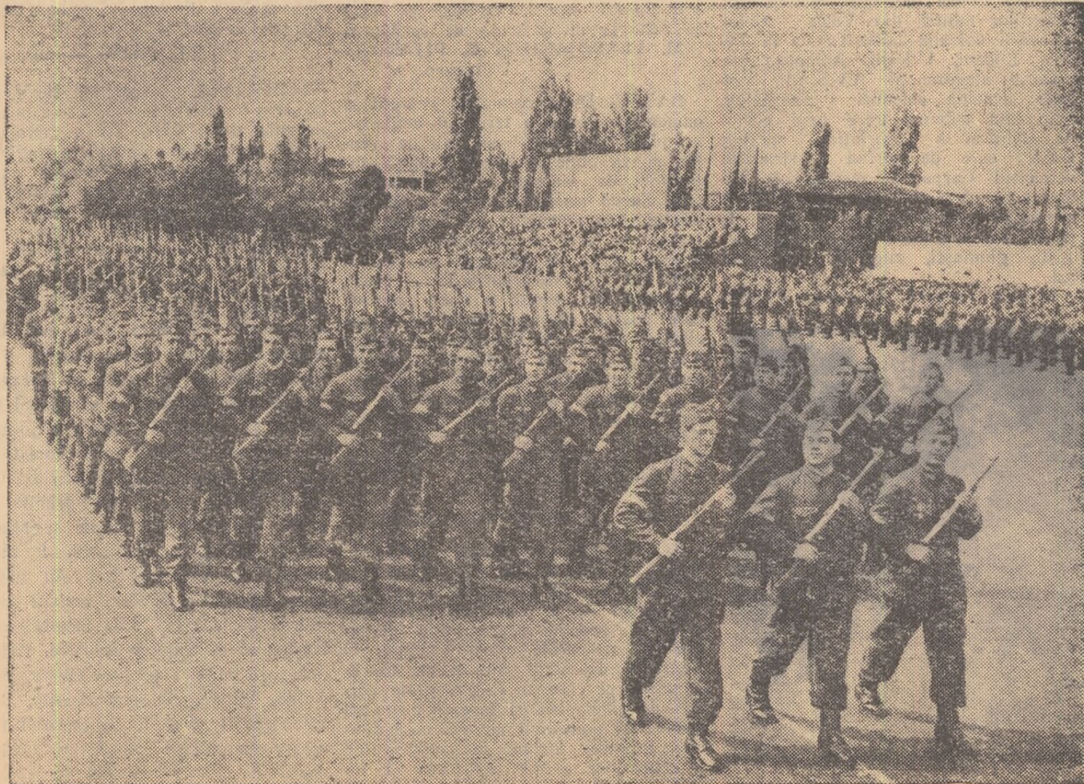
Trec batalioanele gărzilor muncitorești