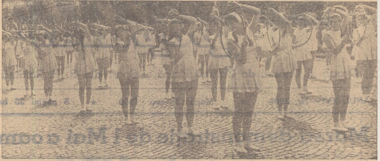
Grație și gingășie... Elevele sportive din Capitală execută un frumos exercițiu de ansamblu cu cercuri.

Sportivii de la Dinamo au prezentat un car alegoric avînd ca temă Jocurile Olimpice de la Roma, la care vor participa și sportivii noștri. Reprezentanții clubului Dinamo au executat frumoase exerciții de gimnastică și o spectaculoasă piramidă pe motociclete, care a cerut din partea grupului de tineri multă măiestrie, îndemnare și curaj.