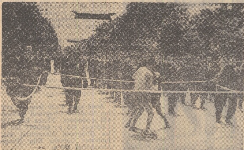
Aspect de la defilarea sportivilor din orașul Ploești.

...Cîteva minute mai tîrziu acordurile Internaționalei răsună puternic, măreț, înălțător, încheind marea demonstrație a oamenilor muncii din Capitală.