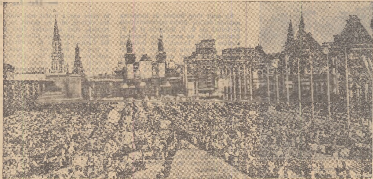
Ieri, în Piața Roșie din Moscova

13-8 LA PHENIAN La mitingul din Phenian au participat 200.000 de oameni. La tribună au urcat Kim Ir Sen, președintele Comitetului Central al Partidului Muncii din Coreea și președintele Cabinetului de Miniștri al R.P.D. Coreene și alți conducători ai Partidului