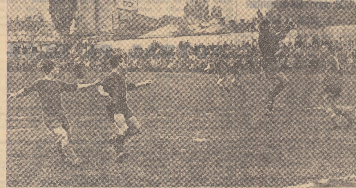
Apărarea Metalului, în formă, lămurește o fusă periculoasă.

DINAMO PITEȘTI — C.F.R. TIMIȘOARA (1-1). — După o repriză în care ambele echipe au contribuit la desfășurarea unui joc plăcut, a urmat o repriză confuză. O.F.R. a deschis scorul prin Feniță (min. 66), iar piteștenii au egalat în min. 89 la o învalmăseală din care nu se știe cine