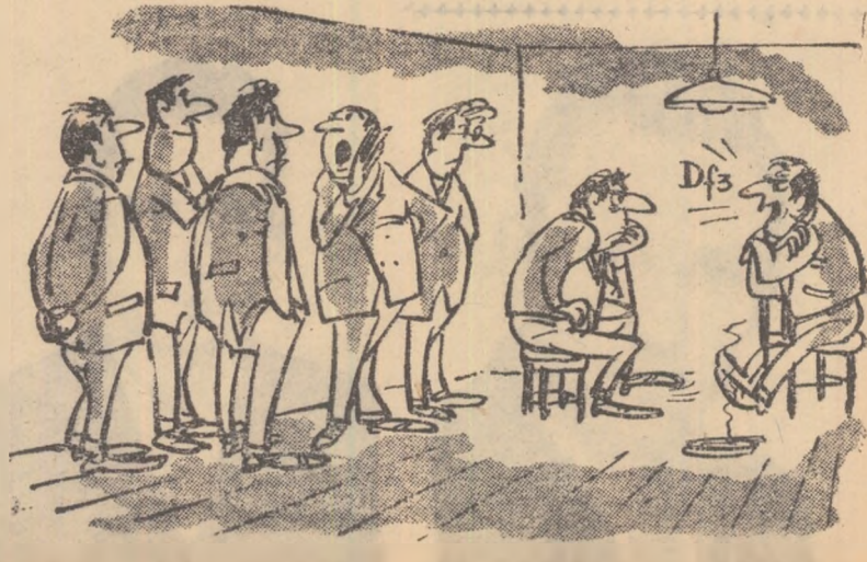
— Eh... De-ar avea și mese... la ce partide um mai vîstu! ! !

Consiliul raional U.C.F.S.-Dej nu se preocupă să asigure amatorilor de șah cele necesare pentru concursuri.