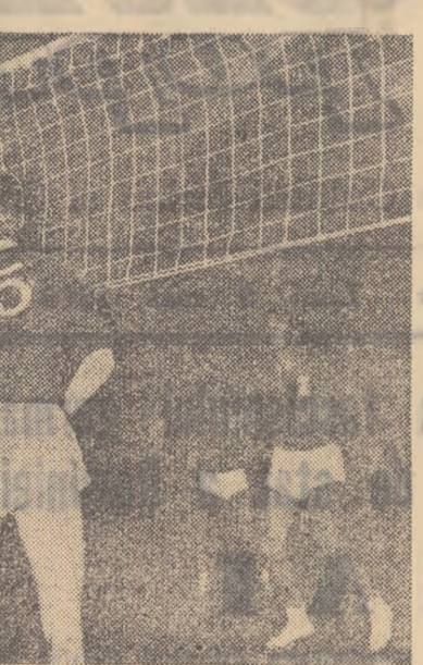
Meciul Constructorul București — Știința Cluj (2-3) a oferit multe faze interesante, printre care și cea „prinsă” de fotoreporterul nostru T. Roibu.