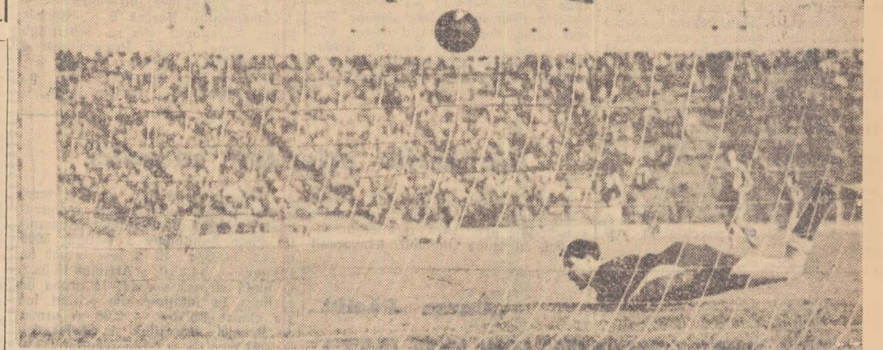
Gol! Portarul echipei Saarbrücken a scăpat balonul din mână și nu-l va mai prinde din nou decât după ce mingea depășise lînia porții: 1-0.