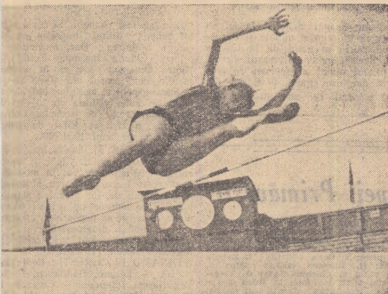
Iolanda Balas a obținut cu 1,80 m cel mai bun rezultat mondial al acestui sezon olimpic