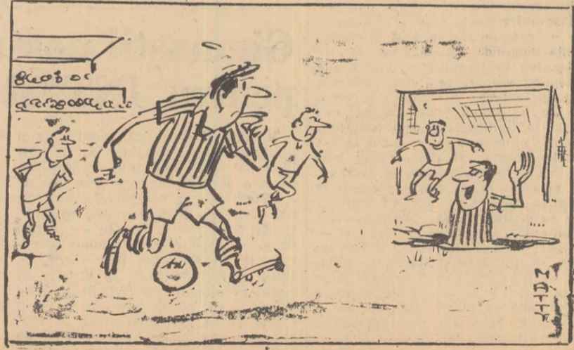
— Bravo, Nae, faci progrese! Pe stadionul ăsta de mult n-a mers cinevîd ota de metri sub 15 secunde!!!