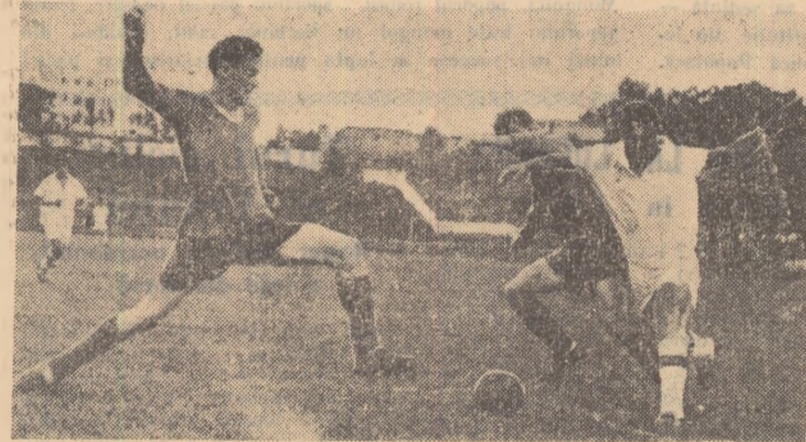
Fază din întâlnirea Unirea Botoșani — Penicilina Iași 4-3. Atac la poarta echipei Unirea.

UNIREA: Manghiel — Olaru, Bolea, Ciorneci — PANTAZIE, Cața-polaș — Popescu, MANAFU,