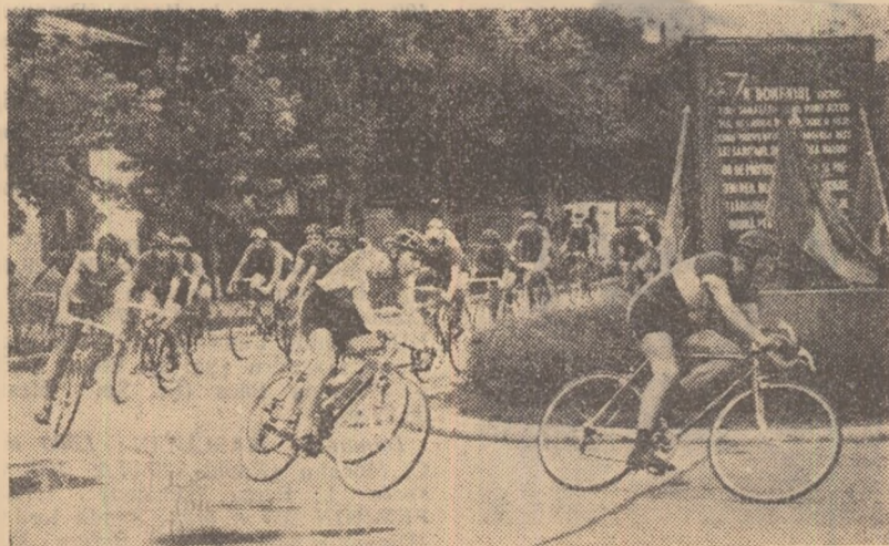
Încă o întoarcere! Aspect de la întrecerile desfășurate ieri pe circuitul din str. Maior Coravu

Cei peste 5.000 spectatori au subliniat, de asemenea, cu aplauze, momentul cînd formația Dinamo a fost premiată. Cu o zi înainte formația dinamovistă reușise în cadrul campionatului de semifond pe echipe să cucerească titlul de campioană a țării cu timpul de 2 h 17:06 (100 km) și să îndeplinească norma olimpică (2 h 18:00).