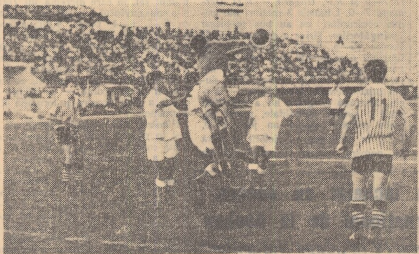
Atac la poarta echipei Aurul Brad. Fază din partida Minerul Oravița—Aurul Brad (3-3), disputată la Ploiești.

— „Partidele au fost diferite ca aspect. În prima (Minerul Oravița—Aurul Brad) calitatea fotbalului a fost bună. Ambele echipe au jucat curat și au construit faze spectaculoase, vădind preocupare pentru calitate. Atitudinea jucătorilor a fost perfect sportivă, ușurând la maximum sarcina arbitrilor. În schimb, celălalt meci a fost de luptă, cu o pronunțată notă de duritate imprimată de Electroputere, după ce a primit golul. În acea-