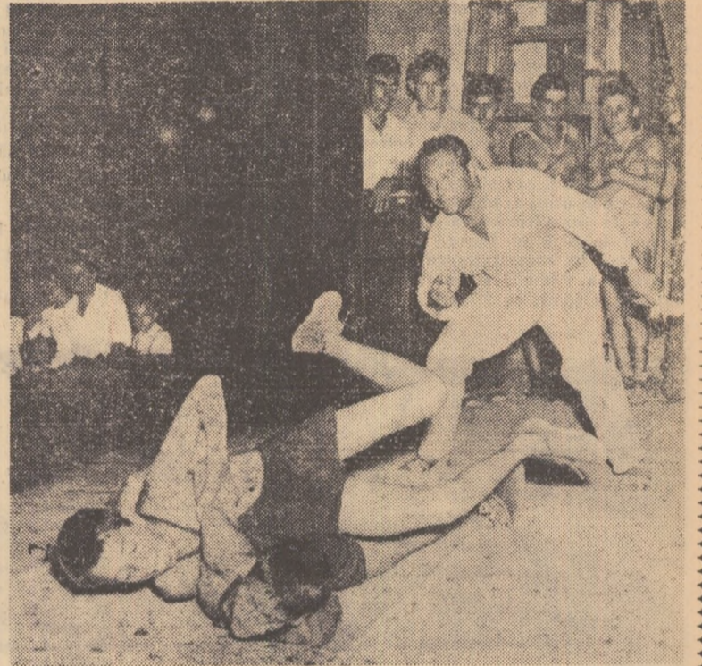
Luptătorii clubului sportiv Rapid au făcut o frumoasă demonstrație cu prilejul Zilei Unionale a sportului.