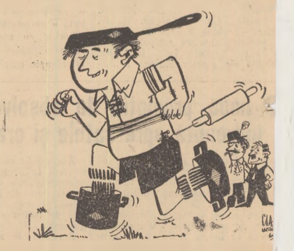
— Și chiar din locul ăsta, cînd am tras o bombă!!!... Desen de MATTY