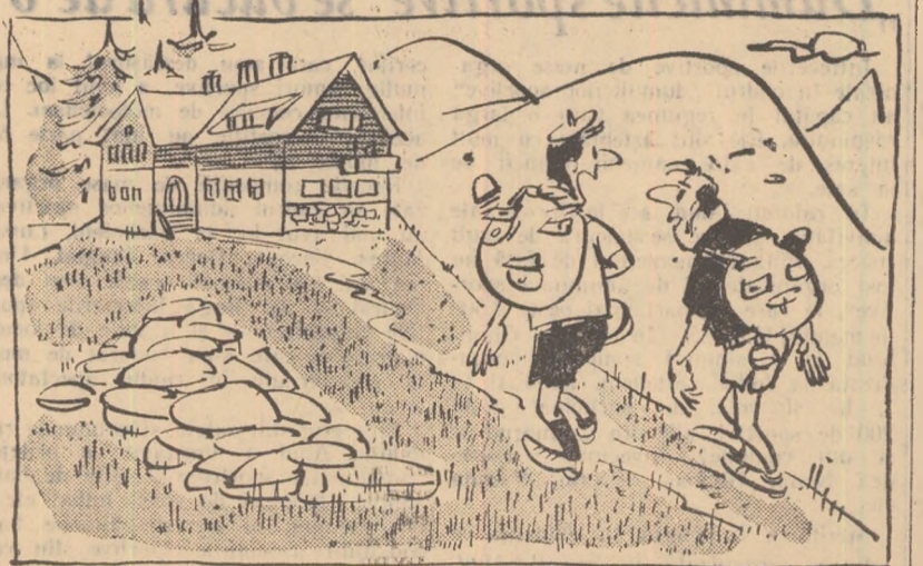
— Eu mai am o șansă să inoptez la cămin! Dar ce te faci tu, că habar n-ai să dansezi!?