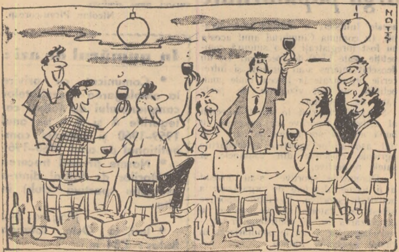
— Inchin pentru toți acei care au plăcut ca pentru A și n-au văzut nici ca pentru ZIL

Apliniștii participanți la etapa a doua a Alpinadei n-au putut fi cazați; la căminul ALPIN din Busești din cauză de... nuntă!!!