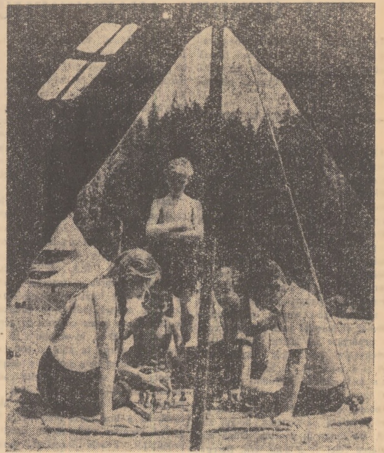
În decorul atrăgător al braziilor veșnic tineri și al primitoareii cabane, o partidă de șah are un farmec deosebit. Asemenea momente sportive — ca acela surprins la Stina de Vale din munții Apuseni — le poți întâlni des, acum, în zilele vacanței, când zecile de tabere de pe întinsul plaiurilor patriei, găzduiesc mii și mii de copii ai oamenilor muncii.