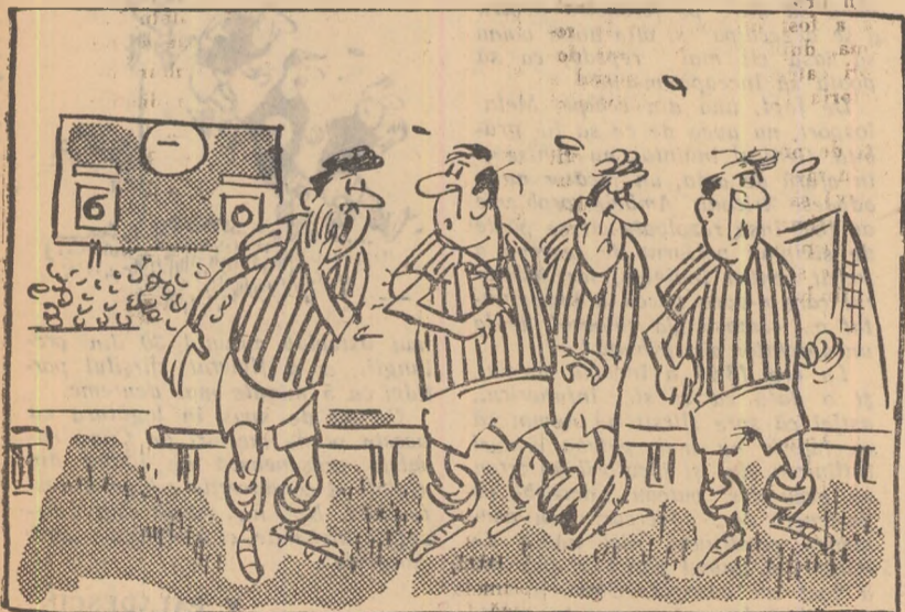
— Ce bine era să fi avut 2—3 puștani în echipă!!! — Ce-ți veni, omule?... — Am fi aruncat totul pe... lipsa lor de experiență!

După terminarea campionatului regional de fotbal, Comisia orașenescă U.C.F.S. Botoșani a ținut ședința de analiză a activității foarte tirziu, formală, cu totul neeficientă. (A. Abramovici — corespondent).