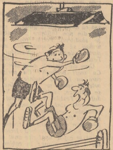
— Formidabilă eschivă! — Vrei să spui „formidabili pan-toși”!!!