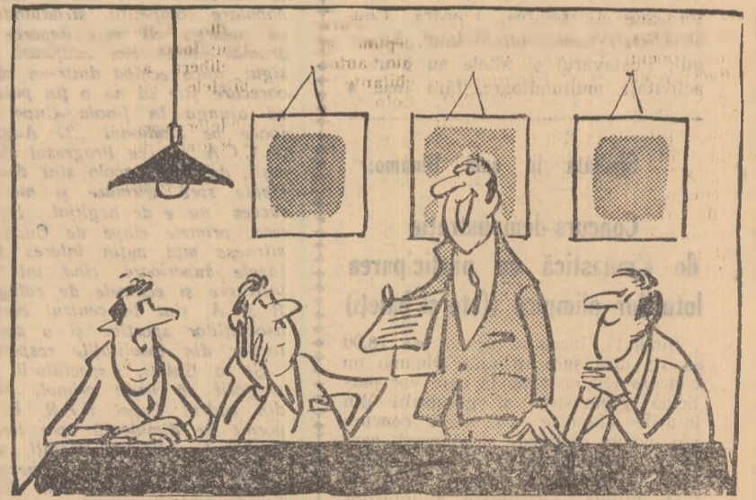
— Dragi tovarăși... întrucît raportul, datele și lipsurile sînt toate venut, propun să ridicăm ședința și să mergem la cinema unde rulează un film Descene de MATTY