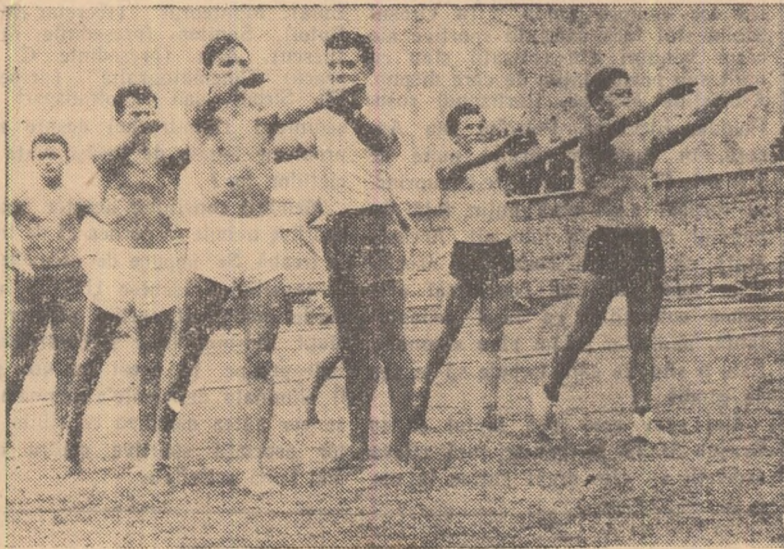
O lecție practică de gimnastică. Sfaturile prof. N. Covaci vor prinde foarte bine la examen