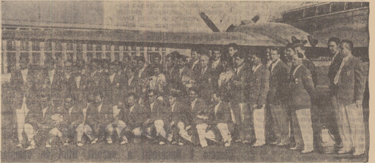
Grupul „olimpicilor”, pe aeroportul Băneasa, cu cîteva minute înainte de decolare.

Pe aeroportul Băneasa, la plecarea unui nou grup de „olimpici”