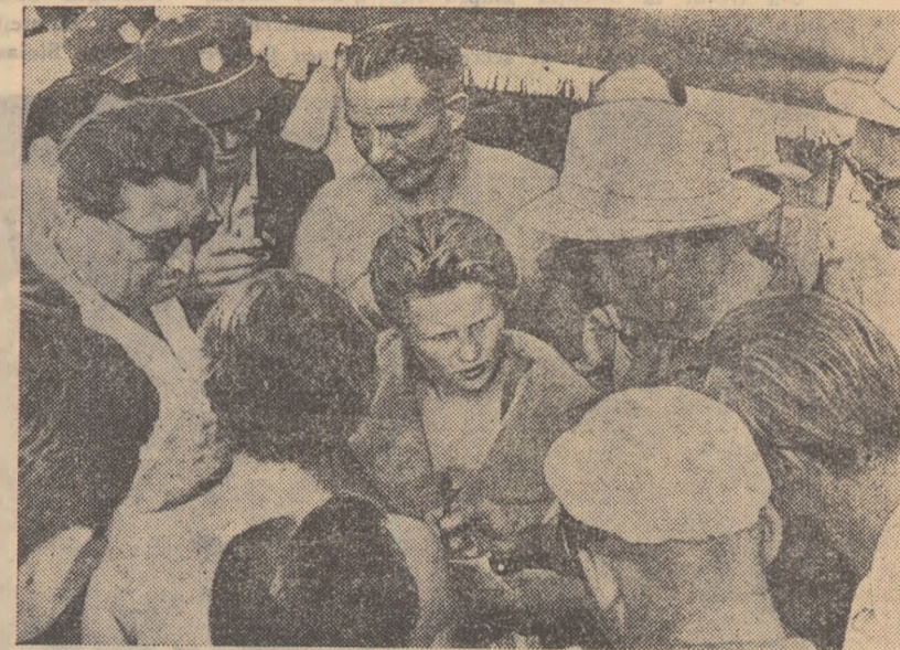
Ingrid Krämer este deosebit de „asaltată” în aceste zile de către a-matorii de autografe. Este și firesc, tinăra înotătoare germană fiind posesoarea a două medalii de aur.