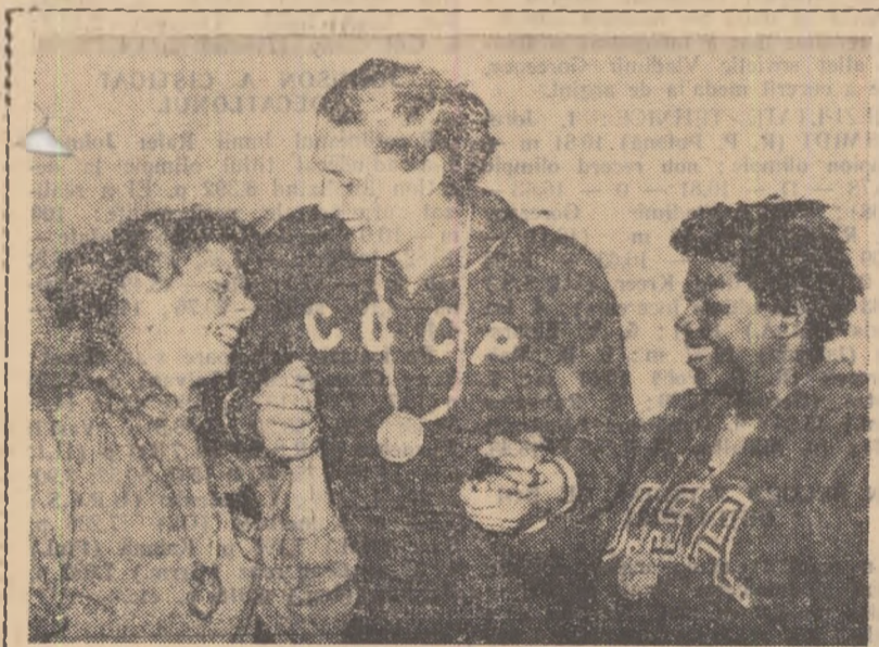
Primele trei clasate la aruncarea greutății. — Tamara Press (U.R.S.S.), Johana Lättge (Germania) și Earlene Brown (S.U.A.) se felicită reciproc

Întrecerea echipelor de hochei pe iarbă se apropie de sfârșit. După ce India a învins cu greu, și numai după prelungiri, Australia cu 1-0, Pakistanul a întrecut la mare luptă echipa Germaniei cu 2-1, Anglia a câștigat la un scor asemănător cu Kenia, iar Spania a învins cu 1-0 Noua Zeelandă, marți au fost cunoscute echipele care își vor disputa semifinalele la 7 septembrie. Programul acestora este următorul: Pakistan — Spania și India — Anglia. Se contează pe o finală India — Pakistan.