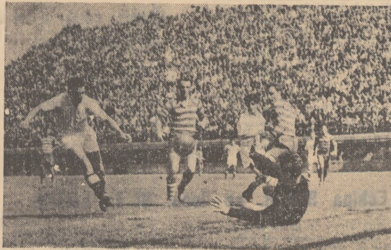
Balint șutează sec din apropiere și tabela de marcaj va arăta 2-2. Fază din meciul Rapid-C.S.M.S. Iași (3-3).