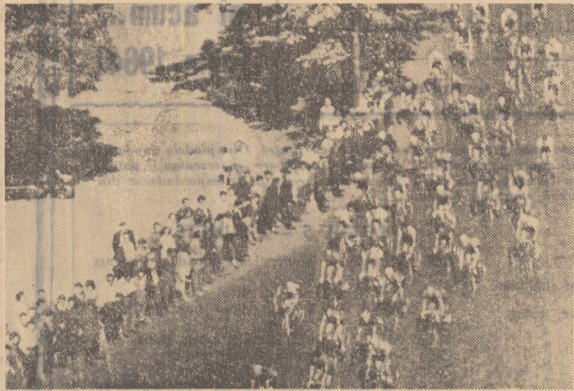
Plutonul este agitat de o nouă acțiune! Fază din prima etapă a „Turului ciclist al R.P. Romîne“, desfășurată ieri în Capitală.