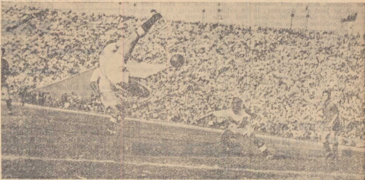
Macri degajează cu o săritură acrobatică

Rapid a jucat excelent și a învins pe C.C.A. cu 3-2 (1-1)