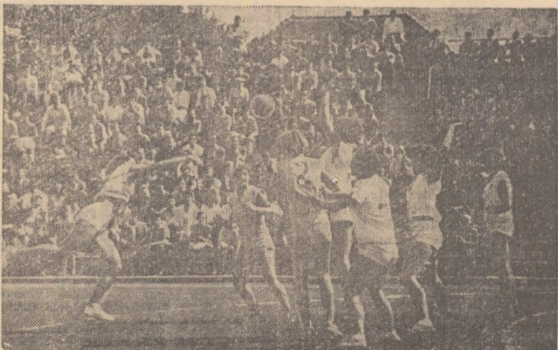
Fază din meciul Progresul București — Știința Timișoara