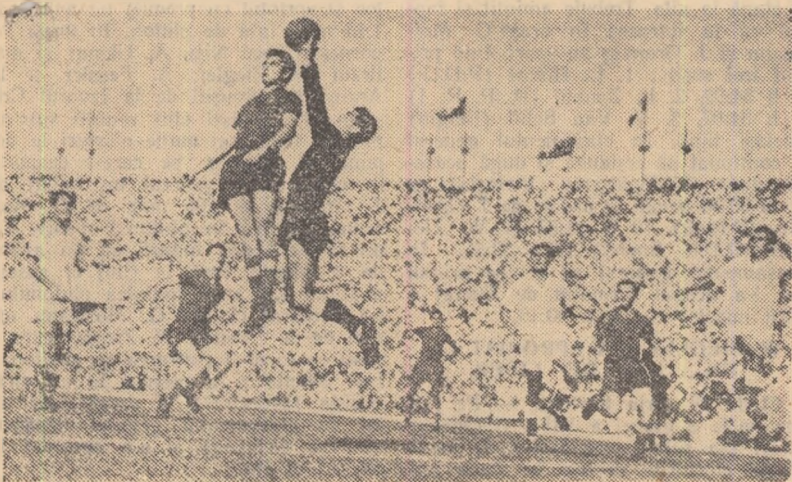
Ene II a sărit foarte bine, dar Mindru va culege balonul

Un șut neașteptat al unui mijlocăș venit în atac, o neatenție a lui Ulu și... din echipă care domina terenul și lăsa impresia că — mai devreme sau mai târziu — tot va marca golul care să-i netezească drumul spre victorie, Dinamo București s-a trezit în fața perspectivei de a părăsi terenul învins... Acest gol marcat de Ioniță în minutul 53 al reprizei secundă a schimbat aspectul întâlnirii Dinamo—Progresul, făcând-o mai atractivă, mai dinamică.