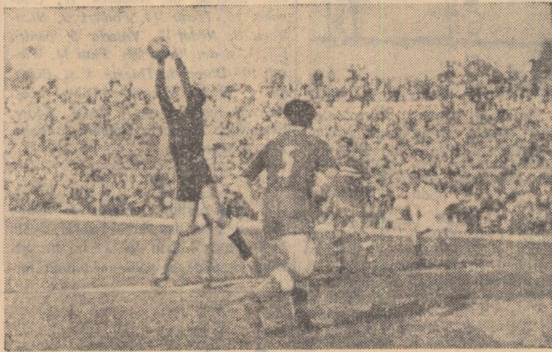
Fază din meciul Farul-Petro. ul (2-2) disputat la Constanța

Acest nou jucător apărea într-un meci deosebit de greu pentru Progresul și faptul că antrenorii l-au introdus totuși în formație presupunea și un act de curaj, dar și convingerea că jucătorul este capabil să facă față jocului. Și așa a fost. Pașcanu