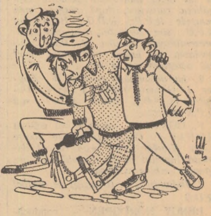
Antrenorul nostru... nu-i băiat rău! Dacă-i ajutat... merge!