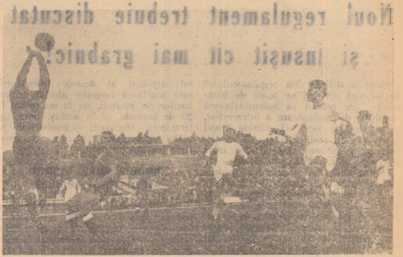
Portarul echipei Academia Militară intervine la un corner executat de metalurgiști. Fază din meciul Metalul București—Academia Militară (2-1).

C.F.R. TIMIȘOARA — RECOLTA CAREI (1-1). Rezultatul oglindește întocmai desfășurarea partidei. Gazdele au jucat mai slab ca de obicei. Meciul a plăcut numeroșilor spectatori prezenți prin fazele sale dinamice, prin nota de sportivitate ce a caracterizat lupta ambelor echipe pentru obținerea victoriei. Au marcat: Ionescu (min. 89) respectiv Szikszai (min. 49). (L. Samuel — coresp.)