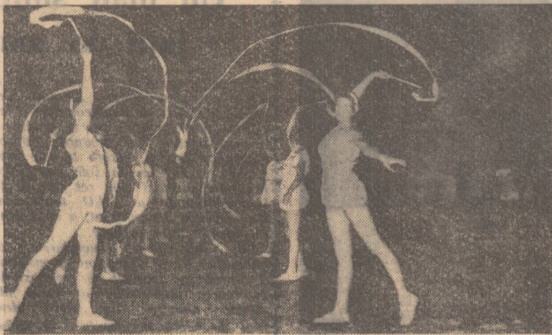
Dansul eșarjelor prezentat de clevele școlilor sportive din Capitală a plăcut prin vioiciunea lui

Din nou ne întrebăm: sînt sportive sau dansatoare? Și una și alta. Ecele școlilor sportive din Capitală