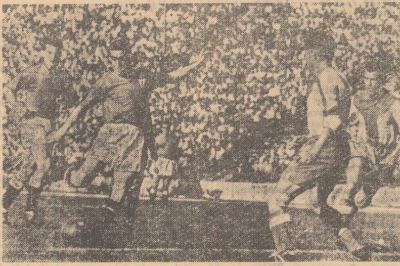
Ozon se pregătește să tragă la poartă. În fața lui, Ciuncan încearcă să pazească șutul. Fază din partida Rapid — Farul 5-1.

Așa cum s-a prezentat ieri, echipa Farului (de nerecunoscut în comparație cu formația care a avut comportări atât de frumoase în campionatul trecut), nu putea ridica prea multe greutăți Rapidului în drumul său spre victorie. Într-adevăr, feroviarul — fără să strălucească, așa cum ar lăsa să se înțeleagă scorul