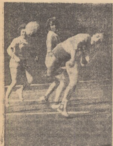
Fază din meciul Știința București — Știința Timișoara

Iată și programul jocurilor din seria a II-a: ORADEA: Rapid—Știința Timișoara; ORAȘUL STALIN: Dinamo—Știința Petroșani; CRAIOVA: Știința—Voința Sibiu; TIMIȘOARA: Tehnometal—Dinamo Tg. Mureș.