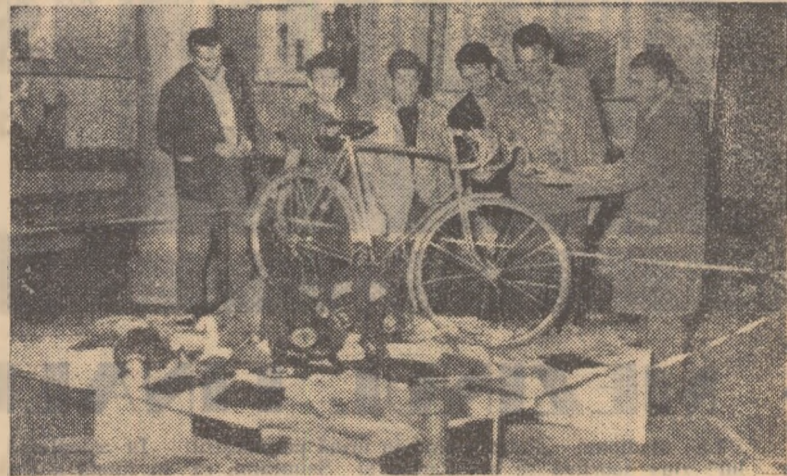
În incinta clubului Dinamo s-a deschis expoziția „Zece ani de cultură fizică socialistă în R. D. Germană”. Expoziția a fost primită cu interes de iubitorii sportului din Capitală. În fotografie, standul de materiale și cărți de sport.