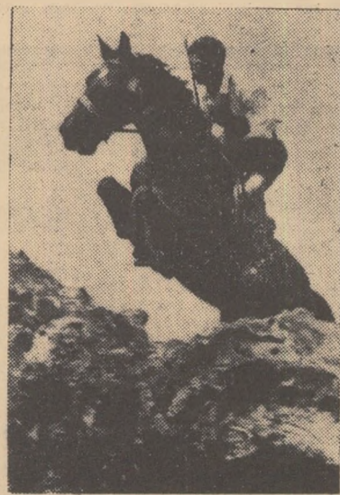
Cristu Lichiardopol (C.C.A.) noul campion republican la pentatlon modern

Clasamentul general individual: 1. C. Lichiardopol (C.C.A. I) - campion (Prog.) 4.914 p. 3. D. Țintea (C.C.A. I) 4.866 p. 4. Gh. Tomiuc (Prog.) 4.755 p. 5. Tr. Croitoru (C.C.A. II) 4.580 p. 6. N. Marinescu (C.C.A. I), 4.294 p. 7. V. Teodorescu (Prog.) 4.002 p. 8. I. Vesa (C.C.A. II) 3.730 p. 9. C. Țintea (Șt. Buc.) 3.700 p. 10. Vl. Lisnevschi (Șt. Buc.) 3.537 p. Clasamentul general pe echipe: 1. C.C.A. I - campioană republicană 13.977,5 p. 2. Progresul 13.628 p. 3. C.C.A. II 11.306 p. 4. Știința București 10.558 p. 5. Dinamo Oradea 8.403 p. 6. A.S.A. Cluj I 7.810 p. 7. A.S.A. Cluj II 6.596 p.