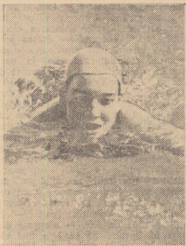
De remarcat poziția ușor ridicată a capului și umerii „degajați” deasupra apei, la brasul recordmanei mondiale Ursula Küper

Androsov și Lavrinenko sînt tipurile ideale pentru înotătorii de demifond. Avînd o talie mijlocie și membrele inferioare relativ subțiri, dar brațe puternice ei pot menține cu ușurință o viteză uniformă pe 30 lungimi de bazin. Revenind la importanța pe care o exercită factorul tehnic în obținerea performanțelor de valoare, observațiile antrenorilor noștri ar fi cît se poate de utile; și aceasta la toate capitolele care alcătuiesc un procedeu tehnic: poziția corpului, mișcarea brațelor (sprijin, tracțiune, împingere), mișcarea picioarelor, coordonarea mișcării brațelor, coordonarea brațelor cu picioarele, respirația.