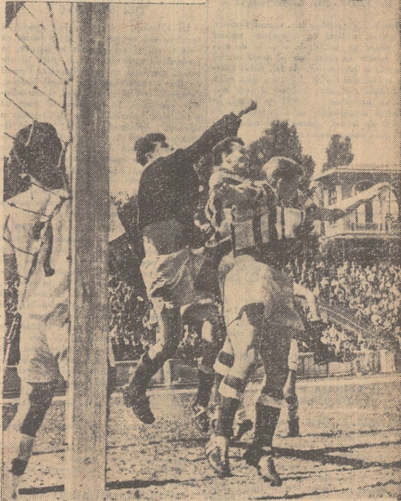
O fază palpitantă din meciul Dinamo București—Dinamo Bacău disputat în turul campionatului trecut. Vor reedita oare cele două echipe duminică jocul interesant din campionatul precedent?