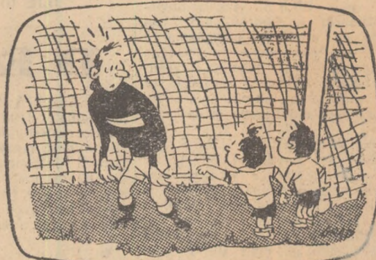
— Nene, dacă stîm cuminți, ne lași să vedem aproape cîteva goluri?

să de victorie nu i s-a ivit lui Anderson. El nu a ajuns, bineînțeles, să boxeze, cu Patterson, totuși s-a convins pe propria piele, cu altă ocazie, că numai forța nu e de ajuns în sportul cu mînuși. Boxînd cu un adversar mediocre Anderson a capitulat în scurt timp. El nu a putut folosi „punctul nevralgic” al adversarului, care printr-un viu joc de picioare a evitat lovitură „atomică”. Extenuat în urma loviturilor trase în gol, Anderson a devenit o pradă sigură, încasînd o serioasă porție de pumnii. Iată cum au luat sfîrșit veleitățile de pugilat ale cunoscutului halterofil.