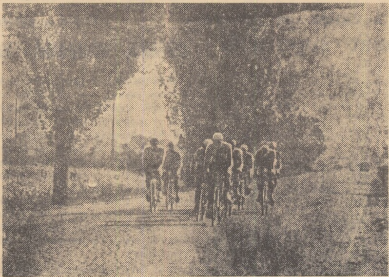
Aspect din timpul unei curse desfășurate ieri în cadrul campionatelor republicane de fond.