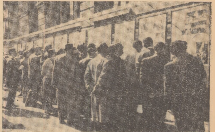
Expoziția stîrnește un viu interes în rîndul iubitorilor sportului. În permanență este aglomerație în fața panourilor.