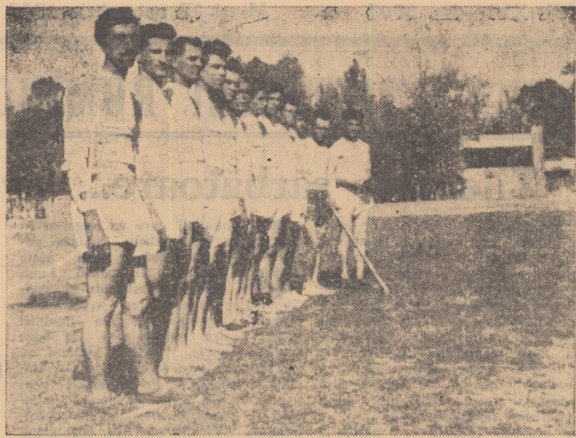
Jucătorii echipei „Viața nouă” Olteni (reg. București), câștigătorii trofeului, salută publicul la sfârșitul unui meci