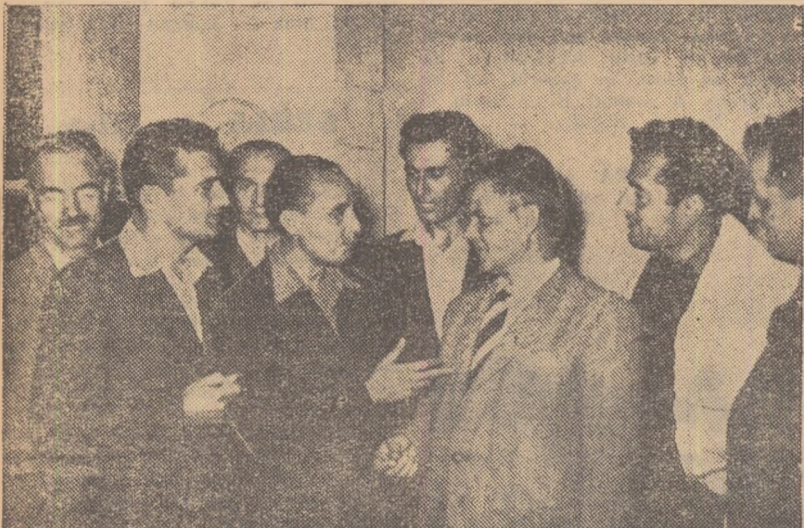
Cîteva dintre participanți continuă să discute, după terminarea consfătuirii. Poate cu acest prilej vor fi preconizate noi măsuri privind dezvoltarea activității sportive de masa