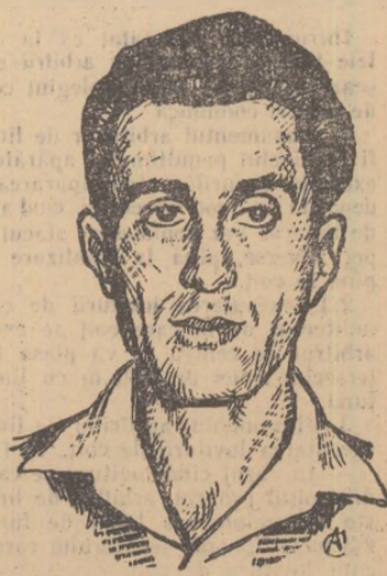
JEAN CRACIUNESCU Desene de CLENCIU