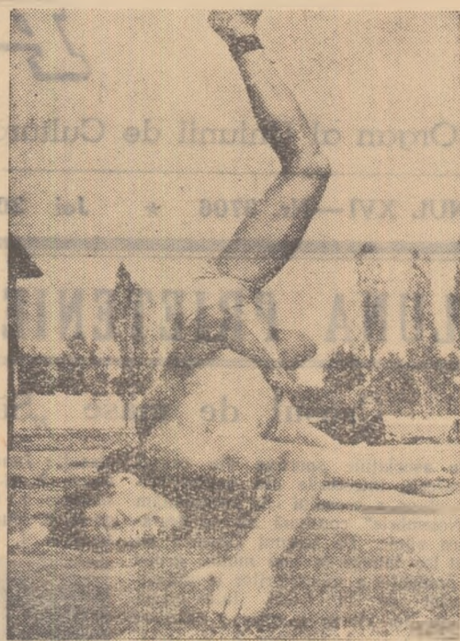
O reușită centură laterală în care luptătorul de sus se apără nereglementar apucând marginea saltei. Fază din camp. R.P.R. juniori-oraș București