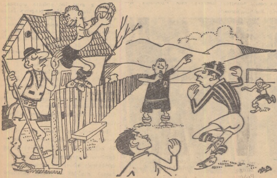
— Da-te jos de pe gard, măi flăcăule! — Imediat, numai să bat tușa...

Terenul de fotbal din Jirlui-Sat, regiunea Galați, se află pe ulița satului, gardurile ogrăzilor ținînd loc de linii de tușă. (SCHENKMAN A. corespondent)