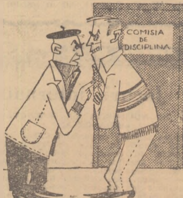
— Sper că măsura luată te va îndemna să faci o cotitură în viața sportivă!!!

Jucătorul Pantazie de la echipa de fotbal „Textila“ Botoșani, suspendat pe timp de un an pentru abateri de la morală sportivă, este totuși delegat de către U.C.F.S.-Raion, ca arbitru. (A. ABRAMOVICI, Botoșani)