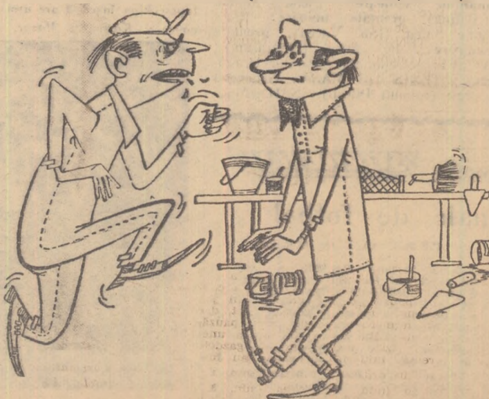
— Ți-am spus să nu-mi pui sculele pe masă! — De ce? Se strică? — Nu! Dar acolo e să punem cimentul!

În sala de șah și tenis de masă a asociației Flamura roșie din Craiova - s-a făcut depozit de scule și materiale de construcții. (M. GHEORGHINOIU, Craiova)