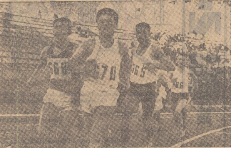
Printre competițiile sportive organizate în cadrul „Lunii Prieteniei Romino-Sovietice” se numără și „Cupa regiunii Ploiești” la atletism-juniori. Iată, în fotografie, un aspect al cursei de 1.500 m

Cele văzute în Uniunea Sovietică, schimbul de experiență efectuat, prietenii legate, ne-au atașat și mai mult de sportivii sovietici, de poporul sovietic, constructor înflăcărat al comunismului.”