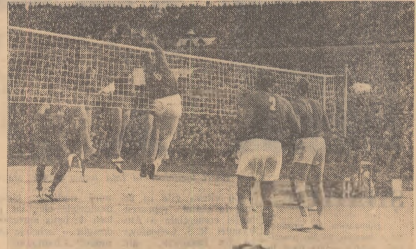
Cu prilejul campionatelor mondiale de volei de la Moscova (1952) a fost stabilit recordul de spectatori. La întîlnirea masculină U.R.S.S.—Cehoslovacia disputată pe stadionul Dinamo au asistat 50.000 de iubitori ai voleiului, „record” care nu a fost egalat sau întrecut pînă acum.

R. P. Ungară cu 3-1 și a fost învinsă de Polonia, Cehoslovacia și Ungaria cu 3-1, iar de echipa Uniunii Sovietice cu 3-0. În urma acestor rezultate am ocupat locul 5, după Uniunea Sovietică, Polonia, Cehoslovacia și Bulgaria și