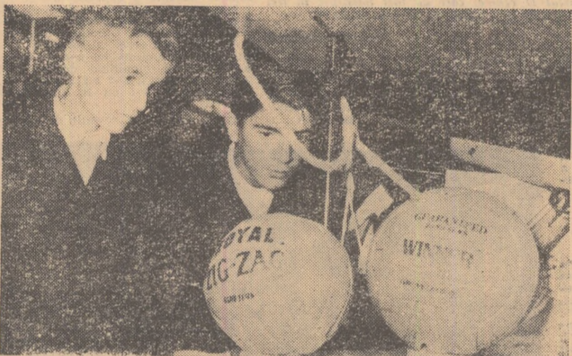
Doi tineri vizitatori în fața unuia dintre standuri