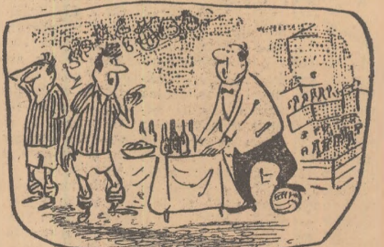
— Tovarășe, spune drept, n-ai văzut căzînd pe aici balonul?... — Care balon? desen de MATTY

În timpul meciului de categoria B, Drubeta T. Severin—Academia Militară București, unul suportorii ai echipei locale „păstru” balonul atunci cînd se rălăcea prin tribune, pentru a „trage” de timp în favoarea echipei locale (Din scrisoarea primită la redacție de la E. Enache).