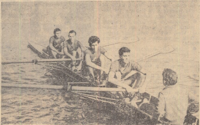
Unul din echipajele tinere care s-au evidențiat în ultimul concurs de pe Snagov, schiflu de 4+1 juniori al clubului Rapid, imediat după terminarea cu succes a probei.

K 2 500 m: Șc. sp. elevi nr. 2 (Andrescu, Șerbănescu) 2:14,0; K 4 750 m: Voința (Ciucă, Crîngulescu, Maxim, Nichifor) 3:03,5; C 1 750 m: M. Șimu (Rapid) 5:05,0; Senioare: S 1 750 m: Elisabeta Rusu (Voința) 3:23,7; S 2 750 m: Rapid (Costela Stanciu, Ștefania Constantinescu) 3:12,3; S 4+1 r: Rapid (Frederica Keizer, Chira Stanciu, Elena Radu, Alexandra Begu + Rodica Bungher)