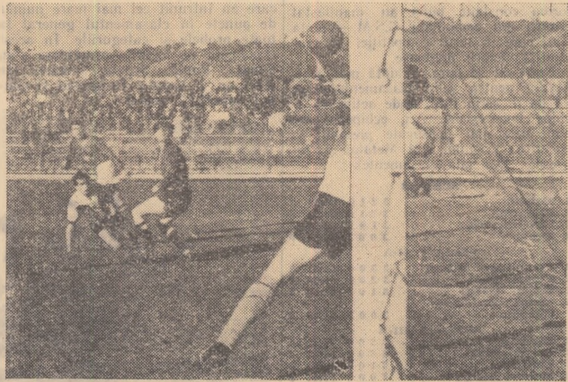
Guian, stoperul echipei din Moreni salvează cu capul un gol ca și făcut. Fază din jocul Lotul A-Flacăra Moreni (8-3).