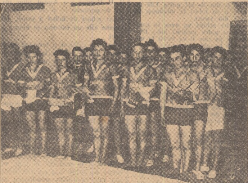
Un grup de tineri... Fotografia ne ajută să facem cunoștință cu campionii întrecerilor de lupte desfășurate în cadrul „Cupei recoltelor bogate”

Socotesc, acum în aceste zile cînd soarele încă mai stăruie pe plaiurile craiovene, și activiștii sportivi. Cifre, date, nume... Apar și în blocnotesul nostru citeva din ele. Un „clasament” al celor mai vrednice asociații sportive ne arată că pînă acum conduce Avîntul Ișalnița unde sportul de masă cuprinde aproape toată comuna. Să vedem însă ce vor zice cei din Pielești și Mofleni, colectivității de la Bratovoști sau Terpezița! Cu școlile, sînt alte socotele. Cele mai multe „puncte” le au elevii din Bucovăț. Bravo lor! S-a terminat vara. Sînt însemnate succesele. 8.683 de