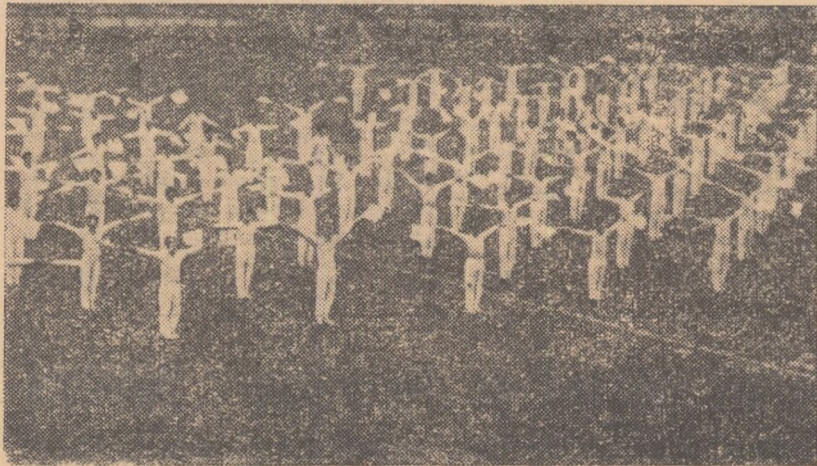
Un moment al demonstrației de gimnastică organizată pe stadionul „23 August” din Iași, cu prilejul festivităților consacrate Centenarului Universității „Al. I. Cuza”.

Din nou, un semnal scurt. Marsul sportiv vestește intrarea pe stadion a unui grup compact de gimnaste — studențe și eleve de la școala medie nr. 2 îmbrăcate în costume policrome. O armonie de culori simbolizează