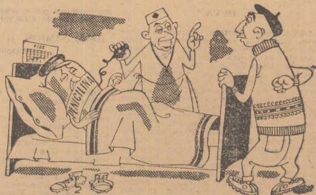
— E grav: 20 cu 1! Ii trebuie un regim foarte sever! — Regim alimentar? — Nu. De... antrenament!