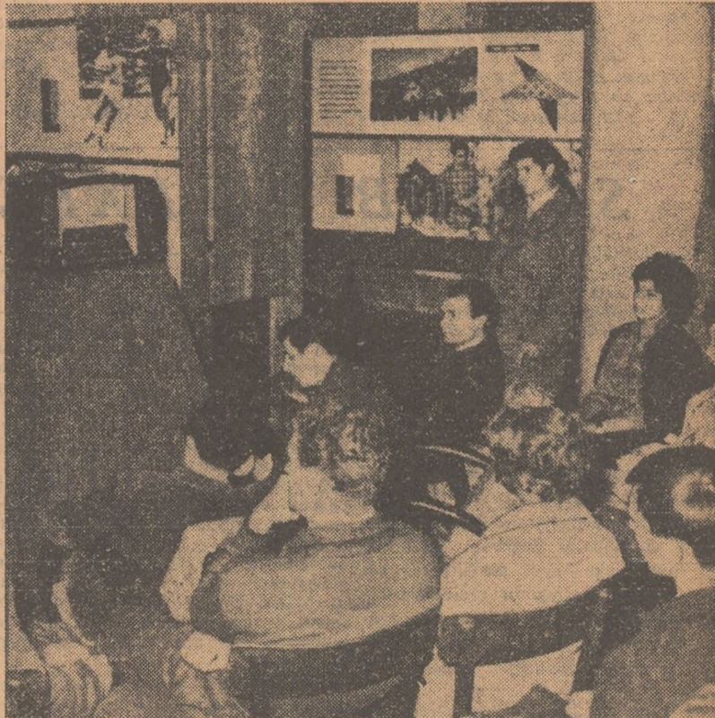
Ieri, în întreaga țară, oamenii muncii au ascultat cu viu interes în fața aparate-lor de radio amplă dare de seamă făcută în sala Palatului R.P. Romine, de tovarășul Gheorghe Gheorghiu-Dej, conducătorul delegației romine la cea de a XV-a sesiune a Adunării Generale a O.N.U., asupra lucrărilor sesiunii și activității delegației țării noastre la această sesiune.

Iată un grup de sportivi fruntași, de la clubul Dinamo din Capitală, urmărind cu deosebită atenție, la sediul clubului, transmisia prin radio a expunerii tovarășului Gheorghe Gheorghiu-Dej.