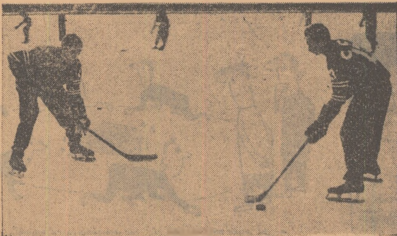
Un aspect de la antrenamentul de ieri al echipei C.C.A.

Pînă atunci, adică pînă la jocurile inaugurale și pînă la prima etapă a campionatului orașului București, pe patinoarul din parcul „23 August” se desfășoară cu intensitate activitatea de pregătire. Un cuvînt de laudă pen-tru tinerii jucători ai echipelor Con-structorul și Știința care și-au în-ceput antrenamentele, dornici ca anul acesta să se afirme și mai mult.