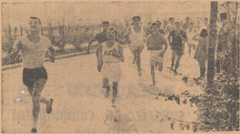
Lupta devine din ce în ce mai dură. Faza din finala pe Capitală a crosului „Să întîmpinăm 7 Noiembrie”. Se întrec seniorii