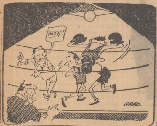
Boxerul. — Și după ce termină de „fini”, ce mă fac, maestre? Desen de GRAD

Meciul de fotbal dintre C.S.M.S. Iași-Penicilina Iași (campionat regional de juniori) a luat sfîrșit cu scorul de... 20-1 de unde rezultă slaba pregătire a juniorilor de la Penicilina.