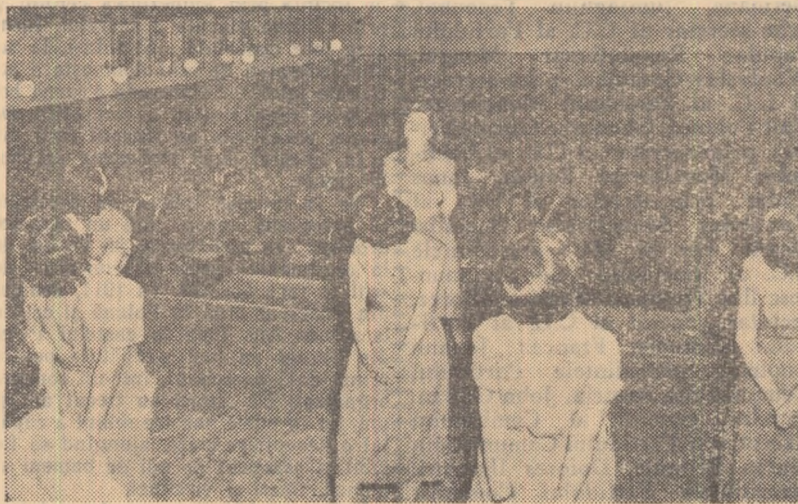
În fața unei asistențe numeroase, muncitoarele de la „Tricotajul roșu” prezintă un fragment din programul lor de gimnastică în producție