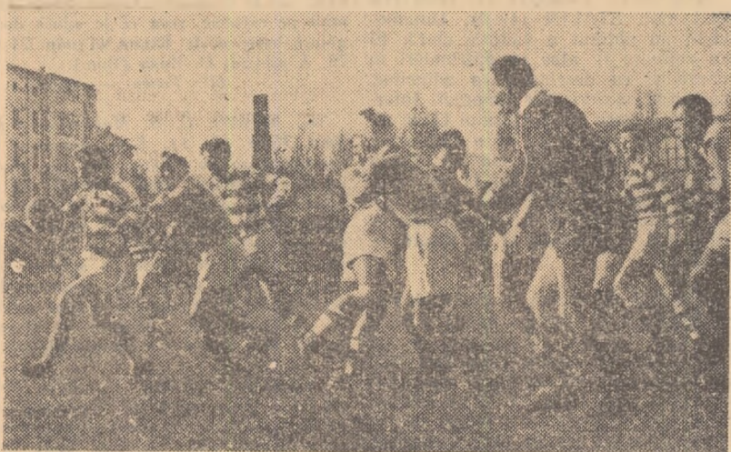
Fază din întâlnirea Știința București — Știința Cluj; luptă aprigă pentru balon în jumătatea de teren a echipei bucureștene

Știința Petroșani a realizat o frumoasă victorie (care a scos-o în mod teoretic din zona echipeilor amenințate de retrogradare) în fața Progresului. Așa cum ne-a relatat și corespondentul nostru, Ion Tudor, înfluiră a fost deosebit de disputată. În prima parte a jocului, oaspeții au