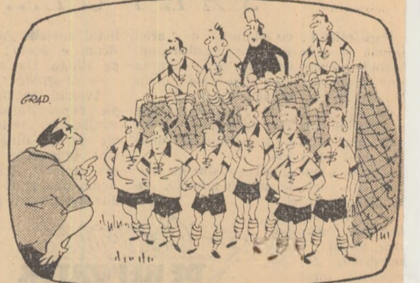
— Antrenorul: — Pentru prima repriză asta e sistemul meu de apărare! În a doua, dacă va fi cazul, mai aduc și cîții suporteri!

Contrar îndrumărilor date de Federația de fotbal pentru aplicarea unei concepții moderne de joc, un antrenor imprimă echipei un joc rudimentar, cu apă rare în 7-8 oameni.