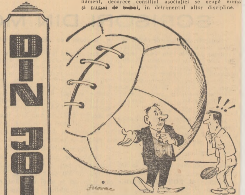
— Tenis de masă? Fugă, măi tovarășe, cu flecurile! Ai în spate „probleme mari” de care să mă ocup!

Jucătorii de tenis de masă ai asociației Dinamo Săsa nu au reușit pînă în prezent să obțină o sală de antrenament, deoarece consiliul asociației se ocupă numai și numai de tenis, în detrimentul altor discipline.