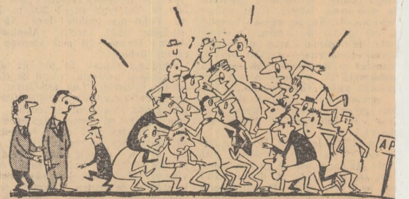
— Și vă plîngeați tov. antrenor că nu găsim elemente pentru rugbi!

Stadionul Metalul din Tîrgoviște are o singură artizană pentru apă