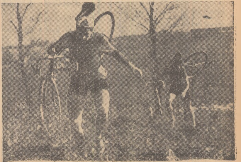
Peste arătura proaspătă este imposibil de rulat. Juniorii (imaginea reprezintă însă din disputa juniorilor) parcurg cu bicicletele pe umăr, această dificilă porțiune.