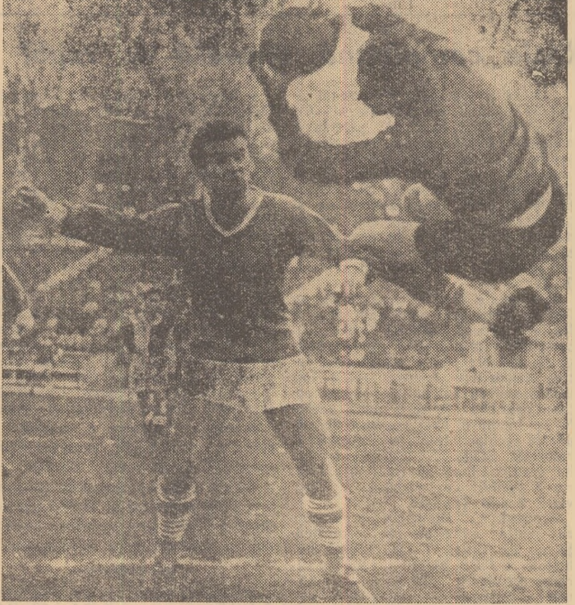
Cu un salt acrobatic portarul echipei maghiare reține o centrare periculoasă