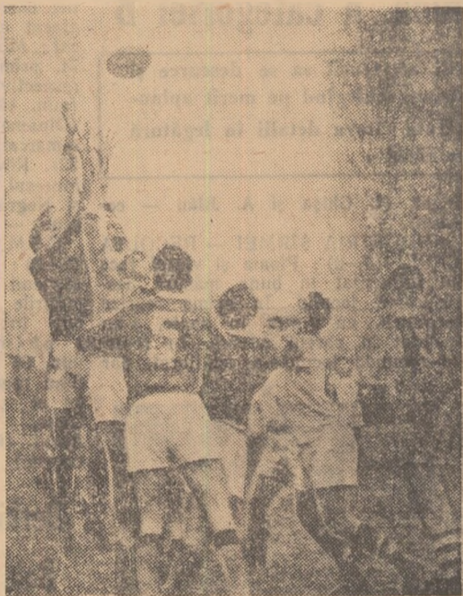
Luptă aprigă pentru balon în meciul C.F.R. Grivița Roșie — C.C.A.

Pentru cel de al doilea loc în campionatul republican ediția 1961, Olim-