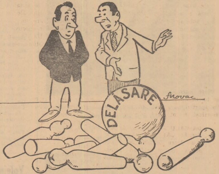
„Și numai cu o singură bilă, conducerea asociației noastre a „dăborât” activitatea popicăriei!!! Desen de S. NOVAC

Arena de popice a asociației „Voința”-Ploiești a fost lăsată în părăsire (I. RĂDULESCU-coresp.)