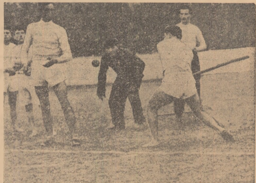
Unul din jucătorii echipei „Viața Nouă” Oltenei (reg. București) execută lovitura de bătăie. Fază din partida Viața Nouă — Dinamo Băneasa

Întîlnirea următoare dintre Progresul și Viața Nouă a plăcut și mai mult. Mulți spectatori veniți la meciurile de rugbi sau la cros au fost atrași în jurul terenului de oină. Cele câteva „prînderi la mijloc”, grupate corect alcătuite de bucureșteni și repetate lovituri executate de ambele echipe peste linia de treișferturi ne-au arătat că oina este frumoasă și în condiții nefavorabile, atunci cînd se întîlnesc echipe bine pregătite. Bucureștenii au știut să fructifice