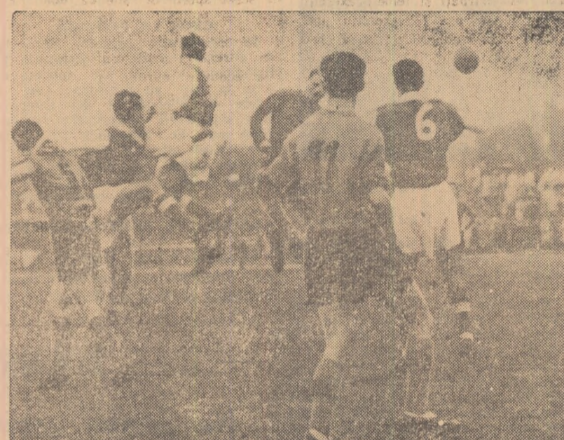
Partida Metalul București — Dinamo Pitești a oferit spectatorilor o luptă dărdă, disputată. Iată o fază din această întâlnire