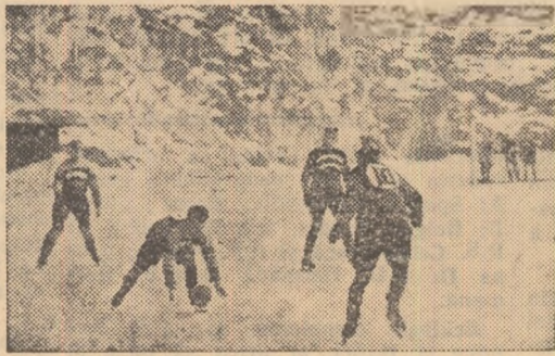
Iată o fază dintr-un joc disputat de handbaliștii hocheiștii ai clubului Korona din Krakovia.

roce echipele au același număr de jucători ca și la hocheiul pe gheață. Așezarea lor pe teren este de altfel identică: 1 portar, 2 fundași și 3 atacanți. Meciurile de handbal pe gheață se dispută pe durata a 2 reprize de cîte 30 de minute cu o pauză de 10 minute între ele. Jucătorii sînt — firește — echipați ca la... hochei, mai puțin croscele și mînușile, iar terenul este ca suprafața la fel ca cel de hochei cu singura diferență că poarta este de dimensiunile celei de la handbal în 7. Pe acest teren se află trasate o linie de centru la jumătatea lui și semicercurile respective, întocmai ca la handbal. De jucat se joacă cu mingea de handbal. Din această cauză, spre deosebire de hochei, există auturi și corcere, mingea sîrînd mai des ca pucul peste mantale. Atît auturile cît și