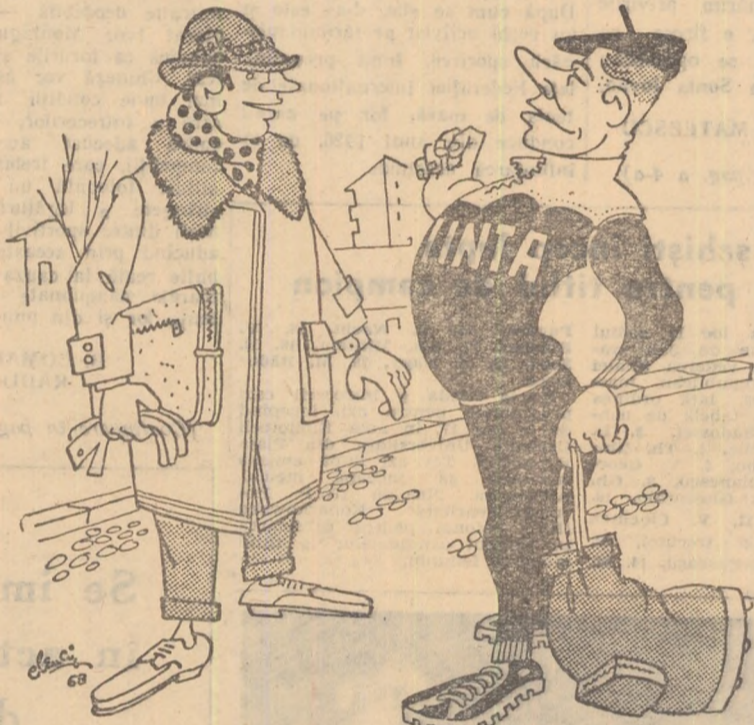
— Prestanță și eleganță! Asta e deviza mea! — Deviza o fi a ta, dar echipamentul e al... clubului!

La clubul Știința Craiova echipamentul sportiv este distribuit fără noimă. Membrii clubului îl folosesc în scopuri personale în oraș, la piață ca și acasă.