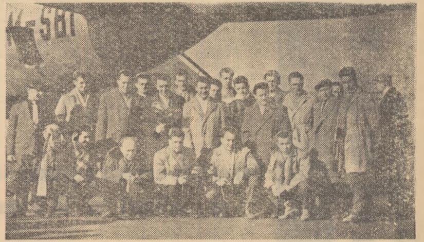
Echipa Empor Rostock la sosirea pe aeroport

își începe turneul cu întîlnirea cu Rapid