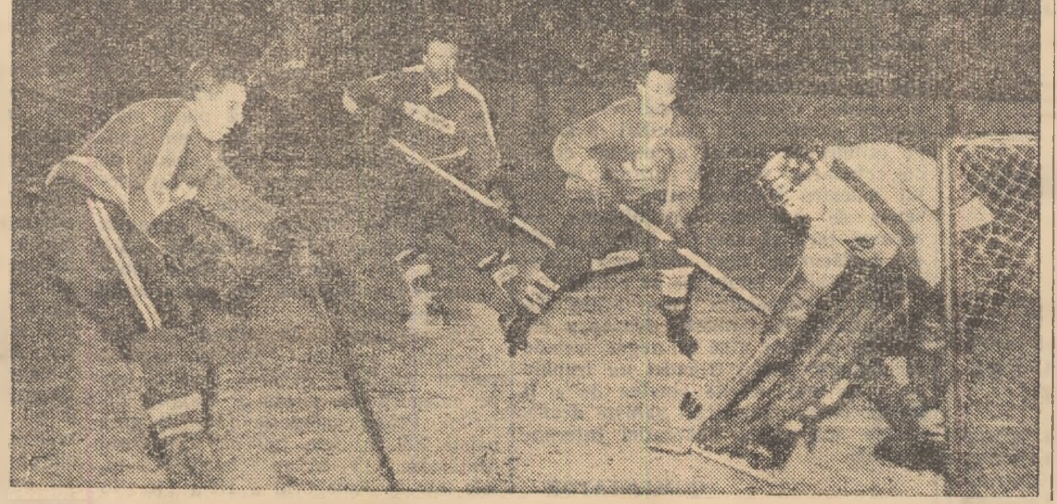
Jocurile din cadrul „Cupei orașului București” au oferit faze dinamice și palpitate, cum este aceasta pe care v-o prezentăm azi. Faza este din meciul Ostrava-Budapesta, încheiat cu victoria echipei cehoslovace.

Jocurile din cadrul celei de a IV-a ediții a „Cupei orașului București” vor avea loc între 13 și 20 februarie.