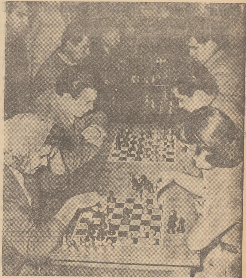
Au început primele întreceri. Membrii asociației sportive Metalosport se întrec la șah