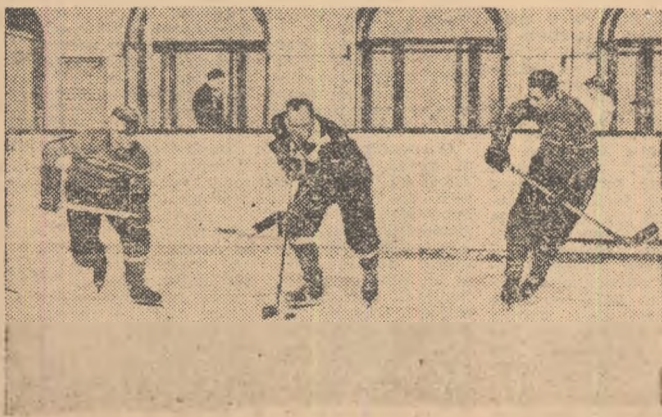
Ieri dimineață echipa de hochei Wissmut Karl Marx Stadt a făcut antrenament la patinoarul „23 August”. In fotografie, un aspect de la antrenament

Cit privește selecționata Capitalei, ea va fi alcătuită pe scheletul selecționatei divizionare.