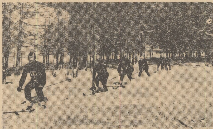
În R.P. Mongolă sezonul sportiv de iarnă este în plină desfășurare. De multă popularitate se bucură schiul care e practicat de un mare număr de tineri. În fotografie, un aspect de la întrecerile organizate de asociația „Munca” într-o fază preliminară a campionatului republican