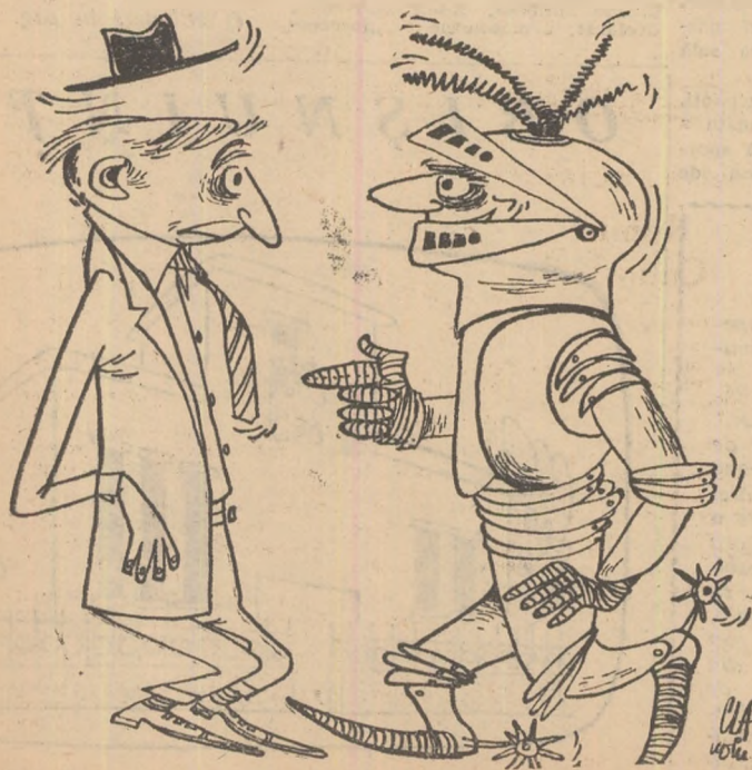
Într-o zi s-ar putea prezenta așa — Mă certăți, dar fac parte dintr-o echipă de fotbal — și diseară avem spectacol!!!