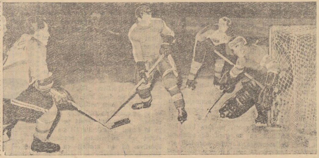
Fază din meciul Selecționata Capitalei — Wismut Karl Marx Stadt

— Astăzi și mâine S. K. Wismut întinește Combinata Știința și Selecționata divizionară