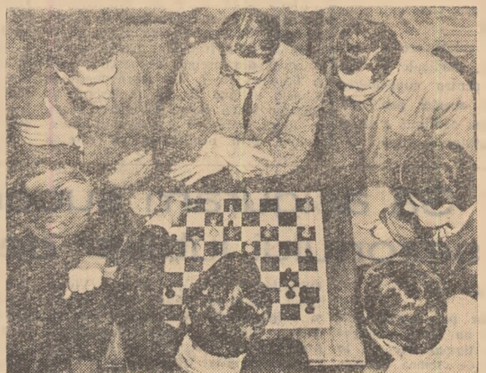
Au început întrecerile Spartachiadei și la asociația sportivă de la I.S.E.B. Primii concurenți își dispută înfîlnirea în concursul de șah

— Nu ții bine paleta — vine prompt primul sfat. E greu. Așa-i Vasilica? E firesc să fie așa. Orice început este la fel. Azi ai făcut primul pas în sport. De acum esențialul este să perseverezi. Poate într-o zi ai să ajungi chiar o jucătoare fruntașă. Principalul însă, este că sportul și-a făcut încă un bun prieten. Unul care va practica cu plăcere tenisul de masă... — b. —