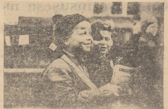
Cadru din film

Ca urmare, echipa „Bezejmenna“ susține apoi