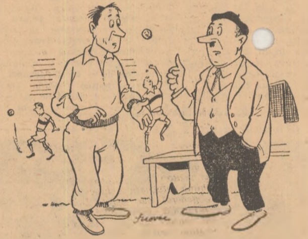
Antrenorul: — N-o să-l pot băga pe Ionescu II în meciul de mîne; nu e în formă! — Ba o să-l bagi; l-a visat soacră-mea mîncînd dulceață cu linguriță de argint. Asta înseamnă că mîne o să fie în zi mare... Desen de S. NOVAC

Mai sînt unii tovarăși din consiliile asociațiilor, care se amestecă în munca antrenorilor