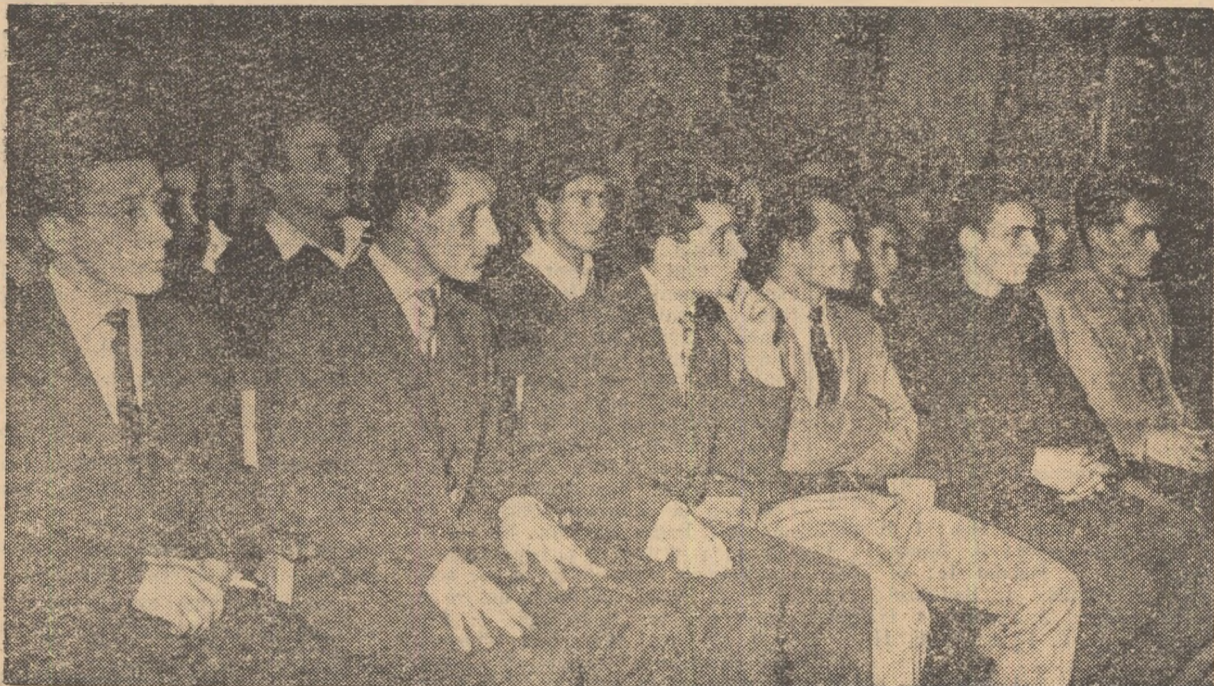
„Vorbește Moscova”... Văștile de la prietenii sovietici sînt ascultate cu un deosebit interes