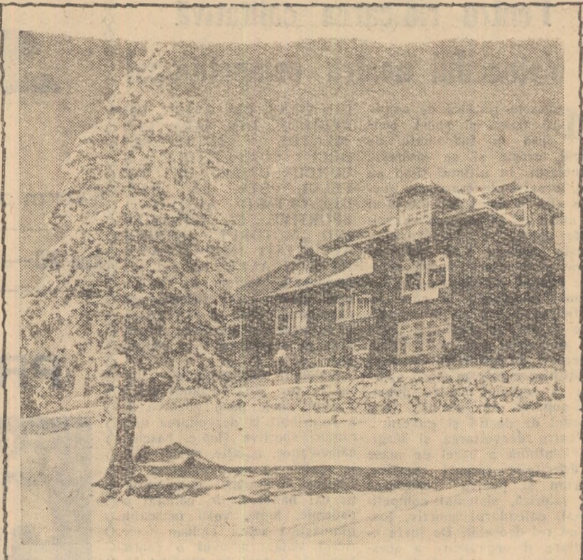
La șes e senin, cald, aproape... primăvară. La munte însă, a nins. Timid, e drept, și doar la înălțimi de peste 1.500 metri. Suficient însă pentru ca iubitorii schiului să pornească la drum, să urce spre Virful de Dor sau spre Postăvar, unde zăpada proaspătă îi așteaptă. Cabana Cristianul Mare din Postăvar, — fotografiată zilele trecute, — ca și alte cabane, vă așteaptă

Avem ca sarcină să mobilizăm pe toți activiștii, tehnicienii și sportivii fruntași pentru a traduce în fapt sarcinile trasate de partid și guvernul mișcării de cultură fizică și sport. Condițiile minunate de dezvoltare create sportului permit un progres continuu pe măsura exigențelor oamenilor muncii din țara noastră.