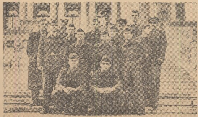
În vederea meciului cu G.C.A., boxerii din echipa Dukla Praga, pe care-i vedeți în fotografie, au sosit joi în Capitală. Citiți amănunțit asupra acestei întâlniri în pag. a 6-a.