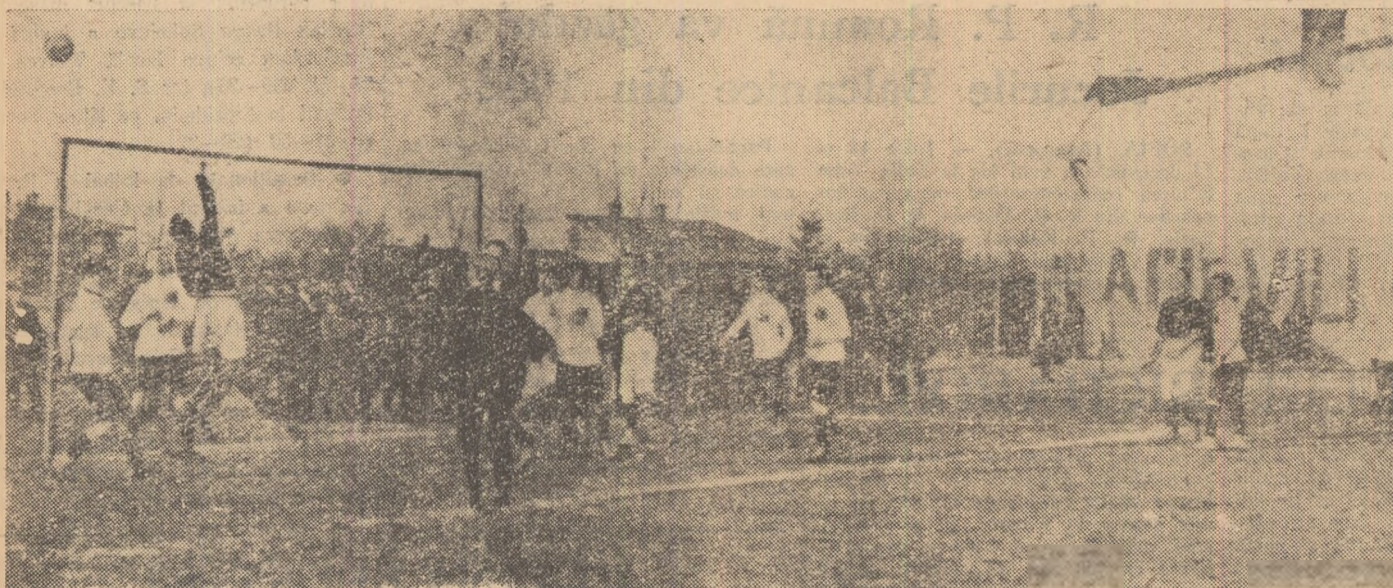
Un meci de campionat disputat în București acum 50 de ani. Arbitrul, îmbrăcat în haine de stradă, cu o șapcă în cap, a venit chiar lingă poartă pentru a vedea ce drum ia mingea, mai ales că poarta nu are plasă...

Prima minge de fotbal a fost adusă în țară în anul 1889, de către un student, care fusese în Elveția. Vîzîndu-l că „bule” mingea pe terenurile virane de la șosea, mulți domni serioși au început să-l apostrofeze: „la te uită! Cogeamăi omul și te joci cu o bușică!”.