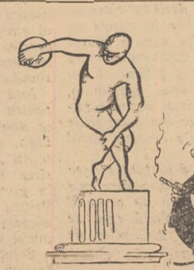
— Iar acesta, mister, este celebrul „Discobol”... — Zici că e celebru? Dacă troce la profesionism îl angajează!!!

„cea mai lungă distanță parcursă înot a mîsurat 150 de kilometri? Cel care a realizat această performanță a fost sovieticul Kozirev. El a înotat timp de 27 de ore!