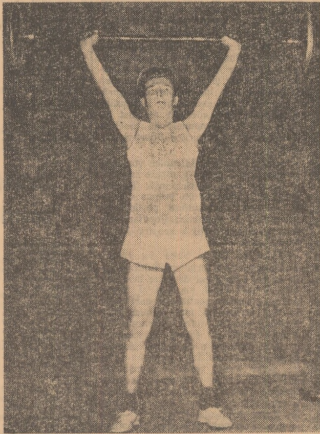
De curînd tinerii din asociația sportivă Spartac au participat la primele concursuri de haltere din cadrul Spartachiadei de iarnă a tineretului