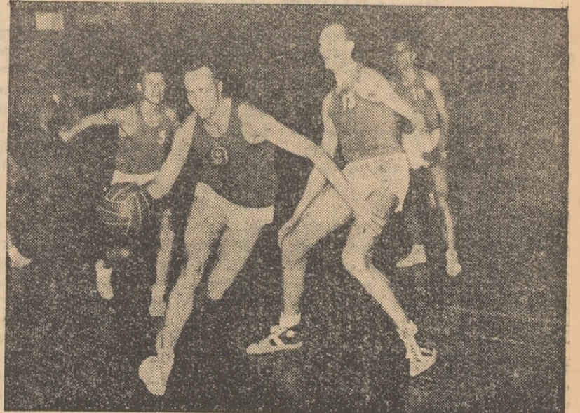
Fază din meciul C.C.A.—Dinamo Oradea

Rapid București—Știința Craiova 76-93 (35-52)!