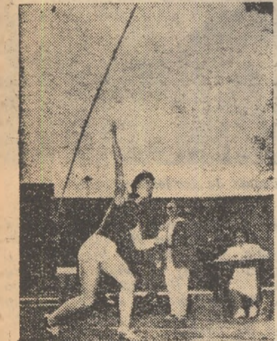
Elvira Ozolina (U.R.S.S.) în timpul aruncării record de 59,55 m pe stadionul Republicii

O impresionantă creștere a rezultatelor și a diferitelor recorduri (mondial, european, olimpic, naționale) a caracterizat proba de aruncarea suliței în anul athletic internațional 1960. În fruntea listei mondiale se află tinăra aruncătoare sovietică Elvira Ozolina, cu un rezultat excepțional de 59,55 m. Această performanță, care