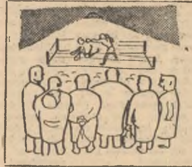
— Tot pierdăm! E mai convenabil prin... neprezentare! Desen de MIHAI GROSU

Atitudinea lipsită de respect a boxerilor de la C.S.M. Cluj față de spectatorii gălațeni trebuie să fie sever sancționată de către federația de specialitate, pentru ca pe viitor asemenea acte de indisciplină să nu se mai repete.