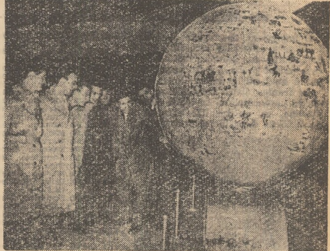
Cu citeva minute înainte de decolarea avionului

Voinescu, Toma, Uțu (portari), Popa, Nunweiler III, Staicu, Ioniță, Panait (fundași).