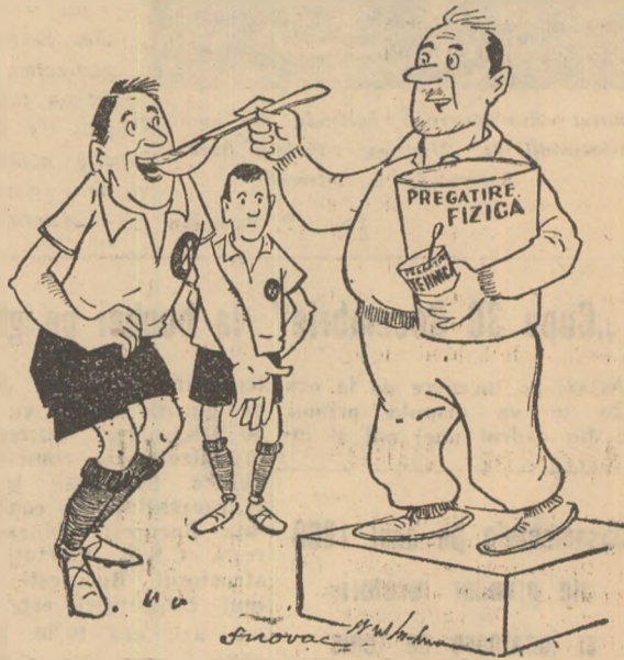
— Cu polonicul și cu lingurița Desen de S. NOVAC

Unii antrenori pun accentul mai mult pe pregătirea fizică a jucătorilor, în detrimentul pregătirii tehnice.